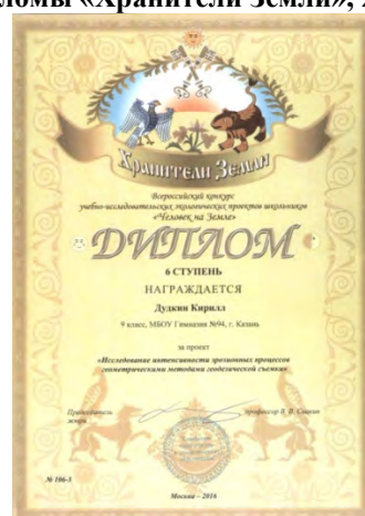
Федеральный этап XI Всероссийского конкурса учебно-исследовательских экологических проектов «Человек на Земле», дипломы «Хранители Земли», 2016 г.