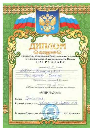
Открытая городская научно-практическая конференция учащихся «Мир науки», победитель, 2016 г.