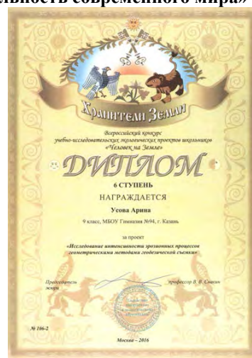
Федеральный этап XI Всероссийского конкурса учебно-исследовательских экологических проектов «Человек на Земле», дипломы «Хранители Земли», 2016 г.