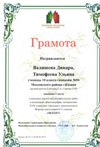
XVII городской открытый экологический форум учащихся 8-11 классов «Зилант», победитель, 2017 г.