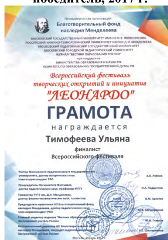
Всероссийский фестиваль творческих открытий и инициатив «Леонардо», диплом финалиста, Москва, 2017 г.