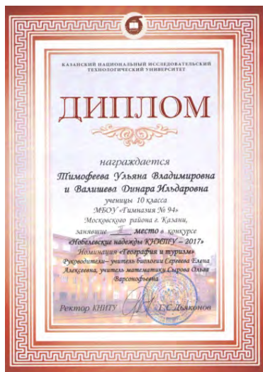
X Конкурс научно-исследовательских и творческих работ «Нобелевские надежды КНИТУ – 2017», призер, 2017 г.