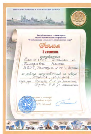
XI Республиканская научно-практическая конференция учащихся «Глобализация – реальность современного мира», победитель, 2017 г.