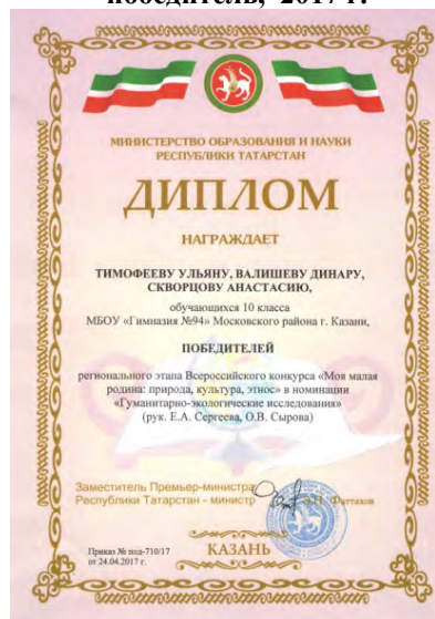
Региональный этап Всероссийского конкурса «Моя малая родина: природа, культура, этнос», победитель, 2017 г.