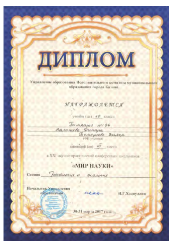
Открытая городская научно-практическая конференция учащихся «Мир науки», призер, 2017 г.

Социально-значимый научно-исследовательский проект «Изучение эколого - геологических аспектов Юрьевской пещеры с использованием методов топографической съемки»