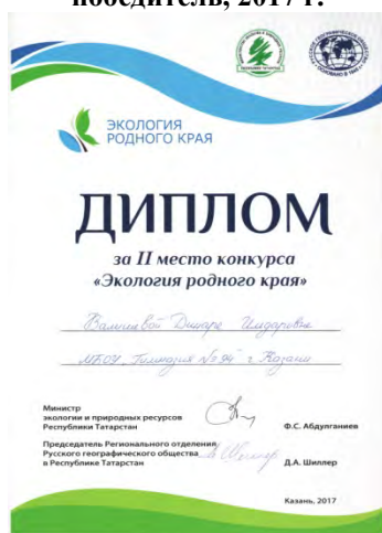
Республиканский конкурс «Экология родного края», призер, 2017 г.