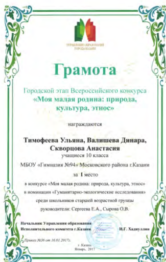
Городской этап Всероссийского конкурса «Моя малая родина: природа, культура, этнос», победитель, 2017 г.