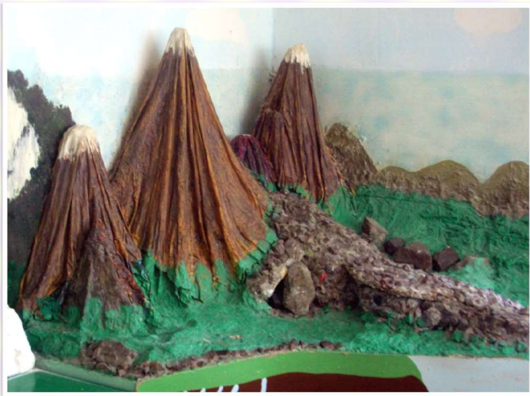
Фото 3. Учебное пособие «Действующая модель вулкана»