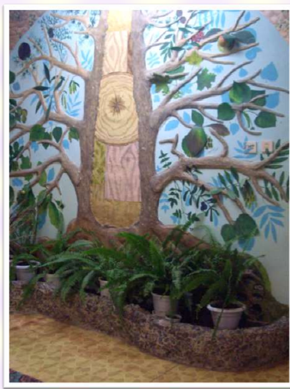
Фото 2. Учебное настенное пособие «Дерево жизни»