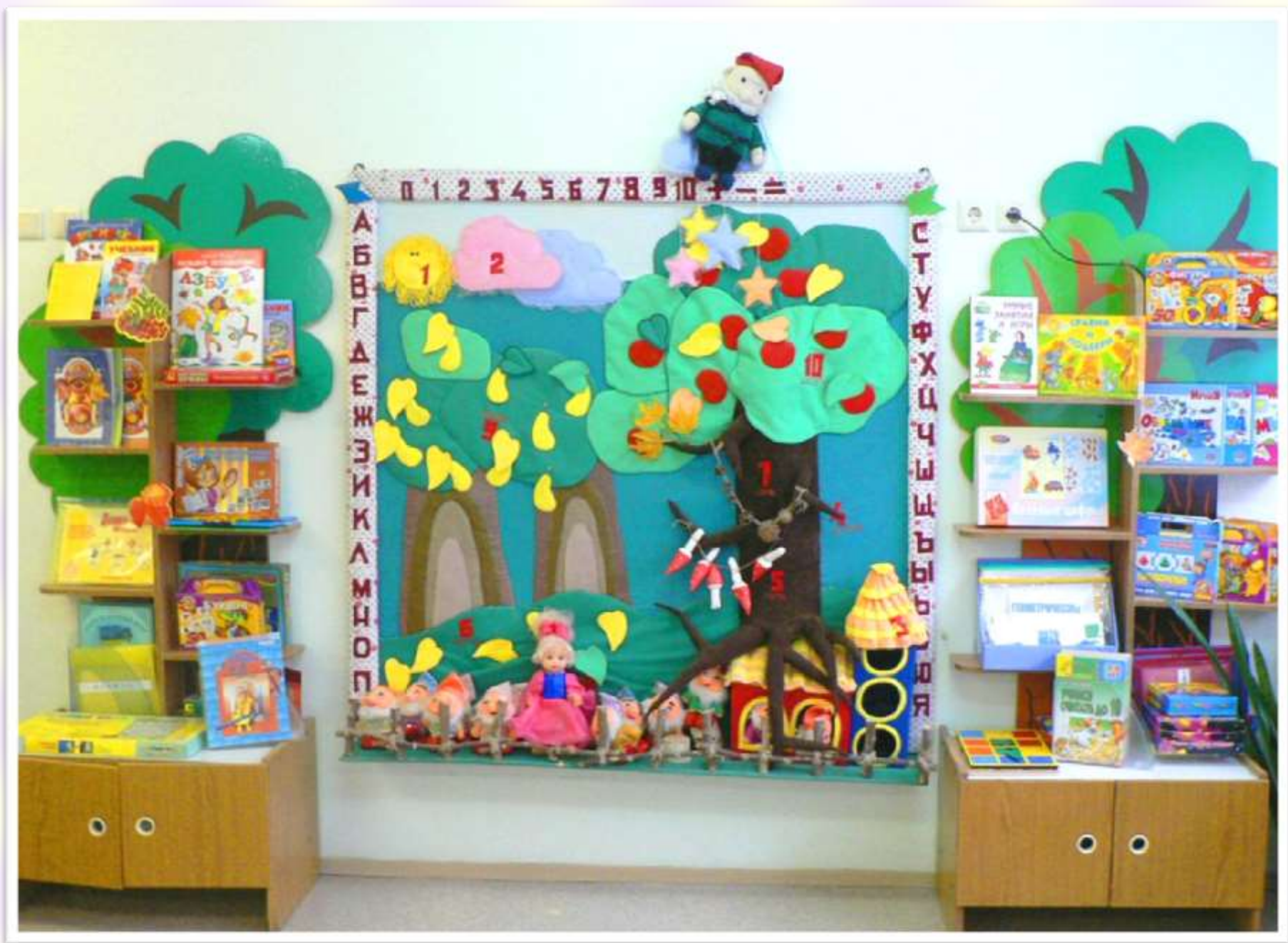
Фото 7. Пример оформления познавательной зоны