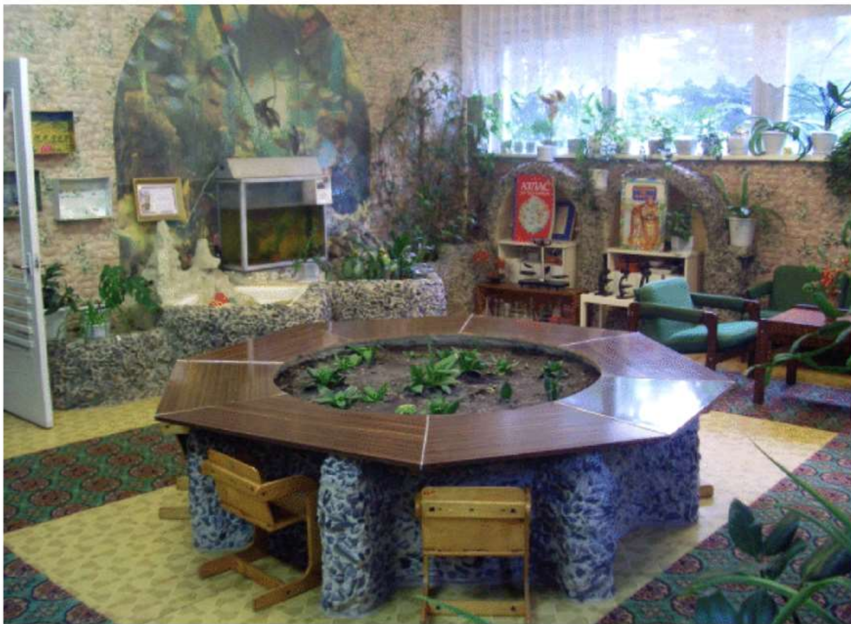
Фото 5. Экологический класс