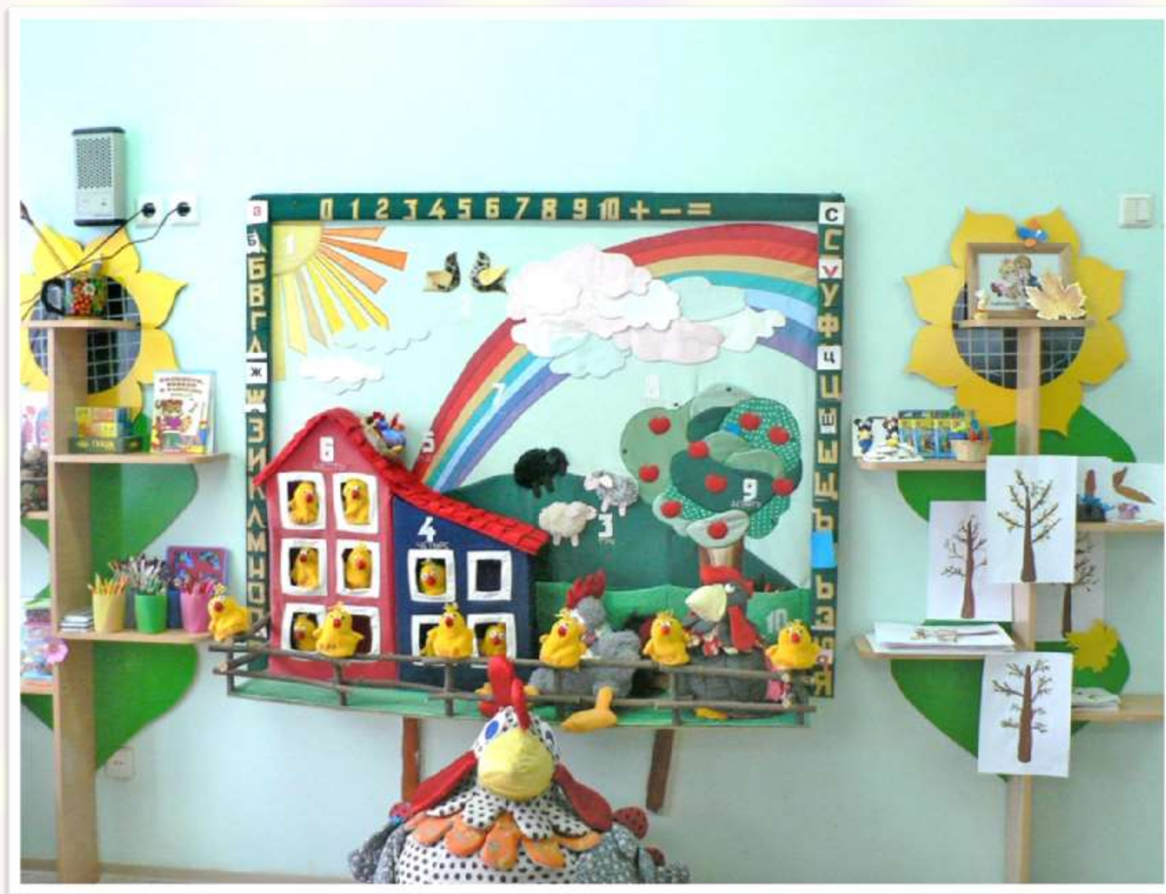
Фото 6. Пример оформления зоны творчества