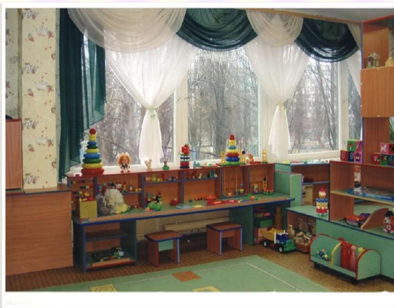
Фото 4. Пример оформления сенсорного стола