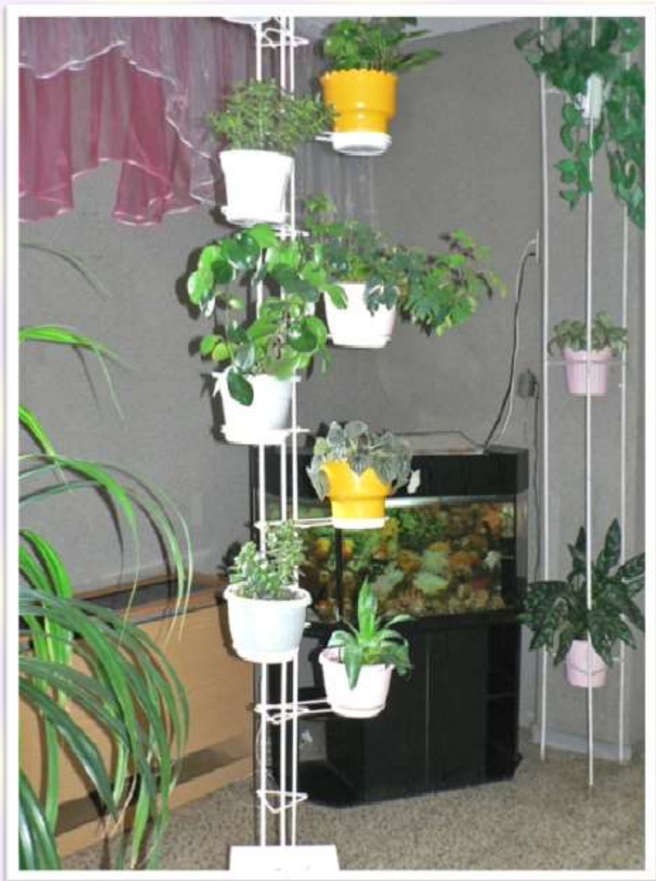
Фото 1. Живой уголок