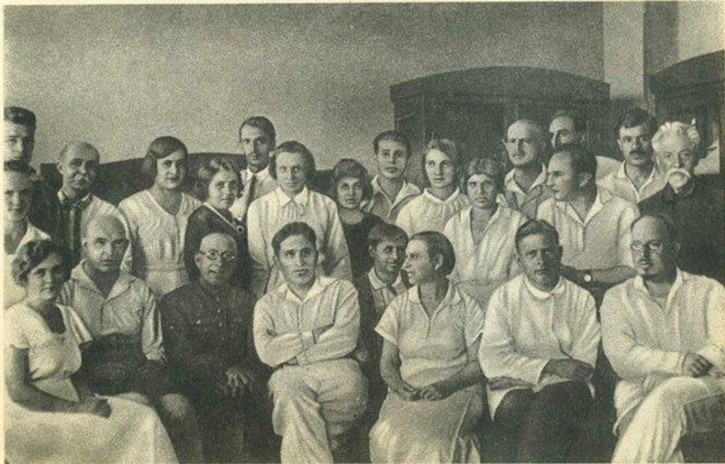
4. Группа педагогов коммуны

Основой успеха педагогической работы А. С. Макаренко считал отношение к своему делу, чтобы в каждом педагоге «горел ОГОНЬ».