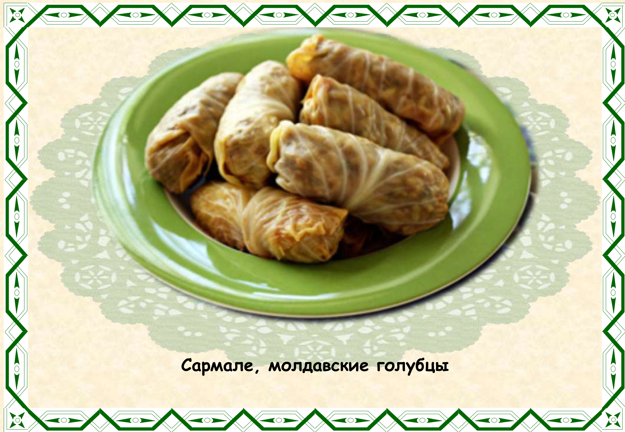
Сармале, молдавские голубцы