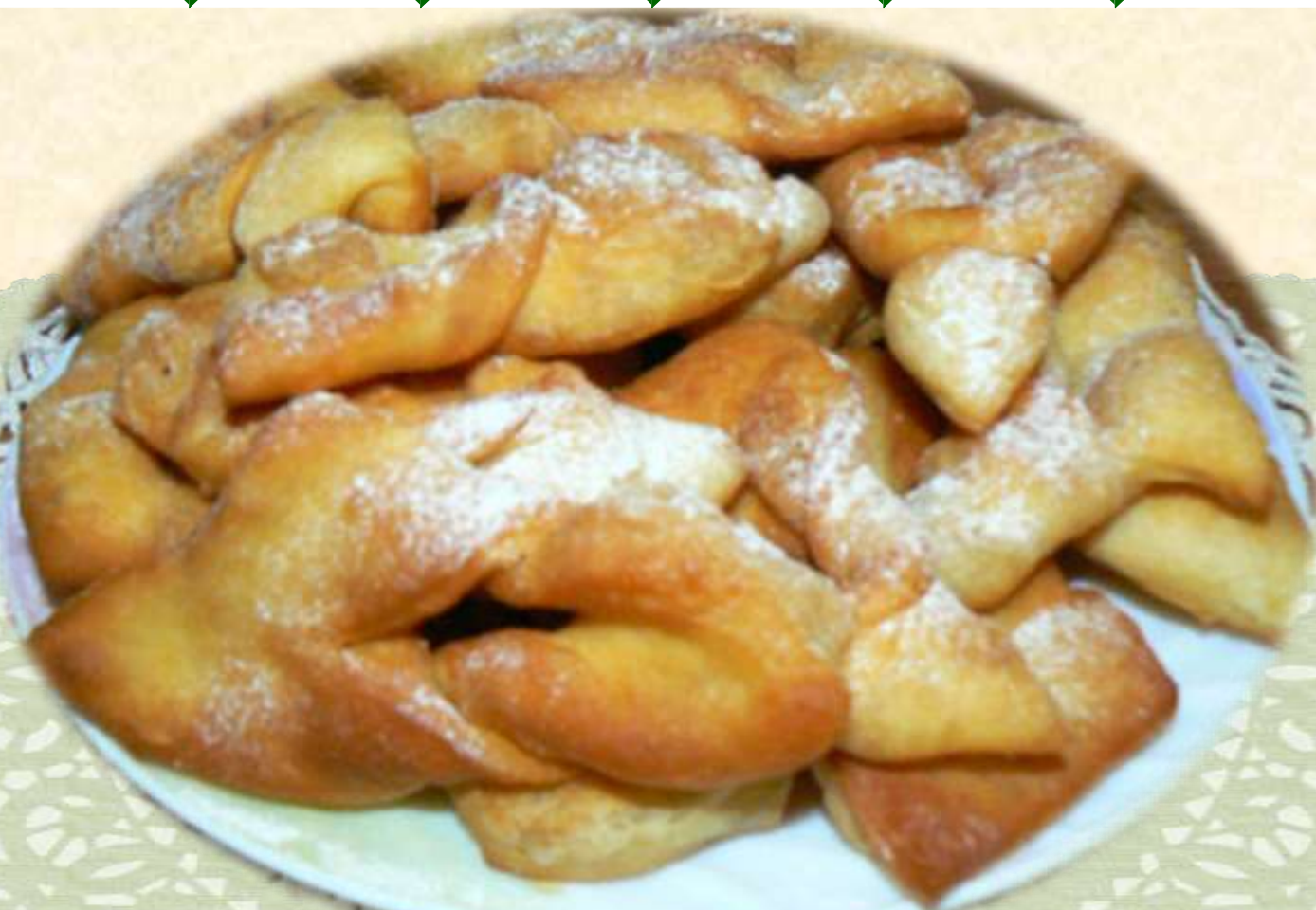
Немецкие кребли (хворост)