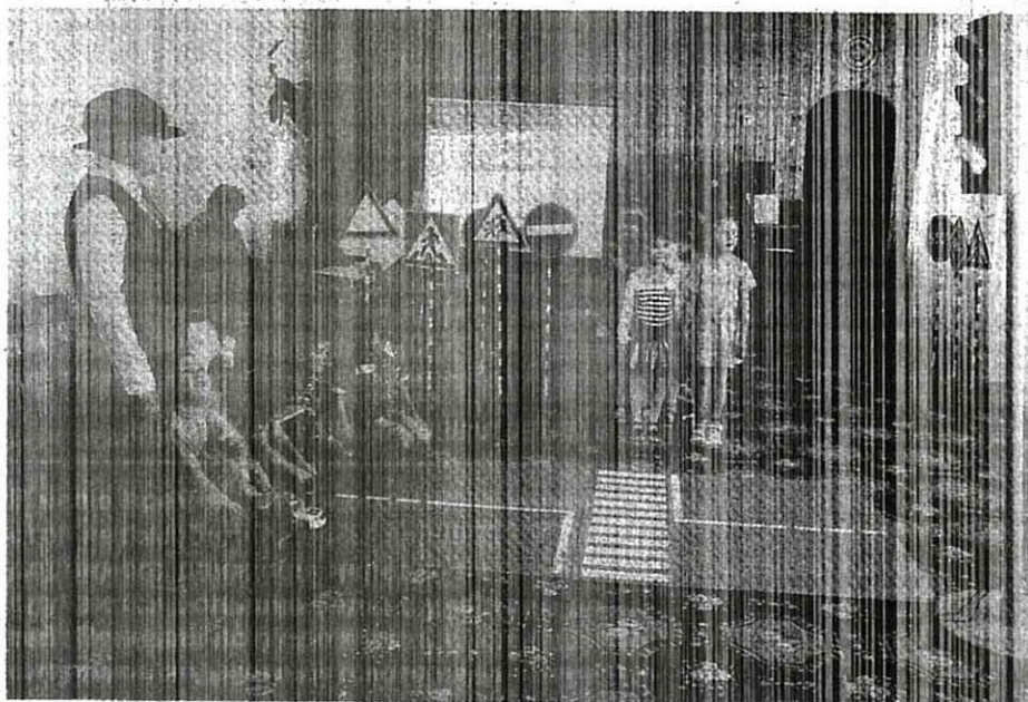
НЕЗНАЙКА ВСЕ ВРЕМЯ МЕШАЛ ДЕТЯМ ВЫПОЛНЯТЬ ЗАДАНИЯ. Фото автора.

В наше время – время огромного количества автомобилей, из-за нарушения правил дорожного движения нередко на дорогах случаются большие беды с участием детей. Понимая всю сложность сложившейся ситуации, педагоги детского сада «Березка» обучают своих дошколят правилам дорожного движения.