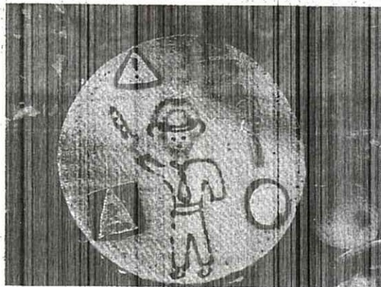
ВОТ КАКОЙ ТОРТ ИСПЕКЛИ РОДИТЕЛИ!

Хочется надеяться на то, что знания, полученные детьми на этом празднике, останутся в их памяти на долгие годы и с ними никогда не случится никакая беда.