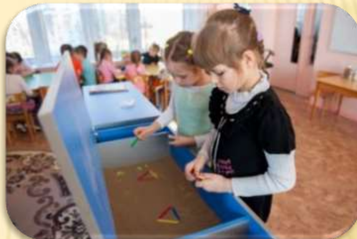
«Фигура из счётных палочек»