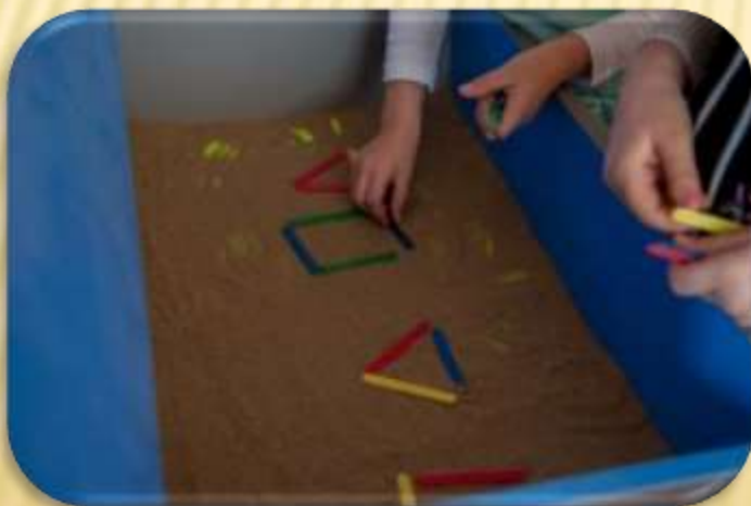
«Узор из геометрических фигур»