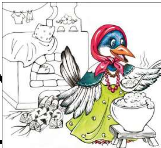
Сорока-білобока лось кашку варила, діточок годувала.

Какое значение имеют игры «Ладушки» и «Сорока - воровка» для маленького ребёнка?