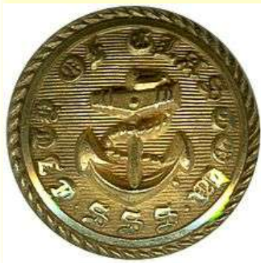
Пуговица мундира члена экипажа парохода из Глазго. 1850-е.