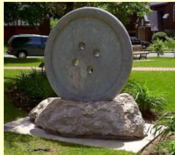
Памятник пуговице в Туркменистане