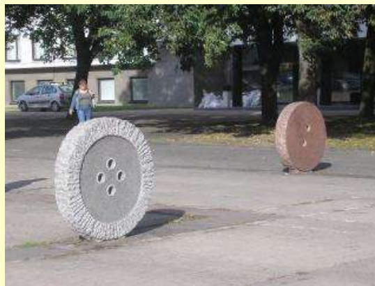
Памятник пуговицам в Каунасе, Литва