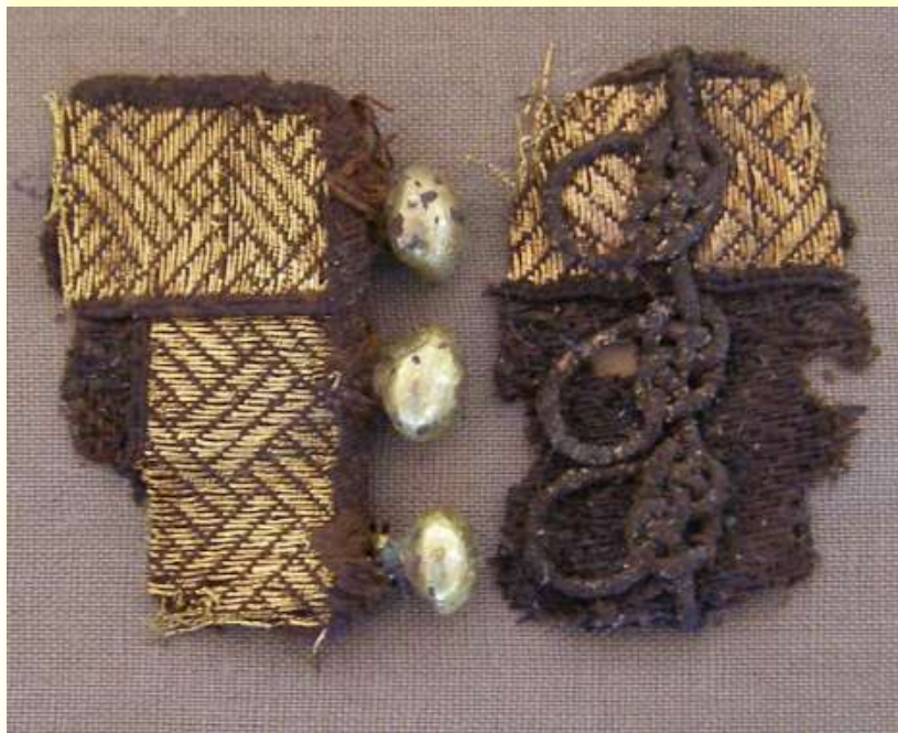
Древние русские пуговицы X-XIII веков