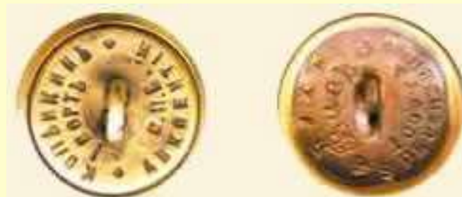
Пуговицы как опознавательный знак