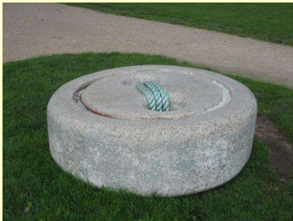
Памятник пуговице в Вентспилсе, Латвия