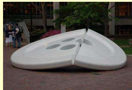
Памятник расколотой пуговице в Филадельфии, США