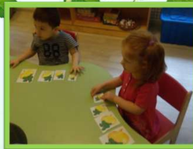
Модель сказки «Репка» по условным заместителям.