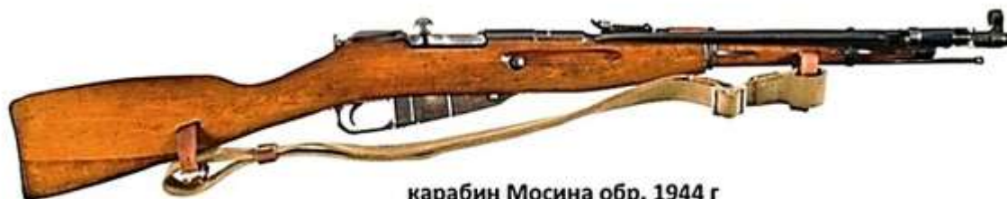
карабин Мосина обр. 1944 г с неотъемным складным штыком