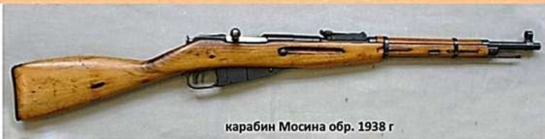
карабин Мосина обр. 1938 г