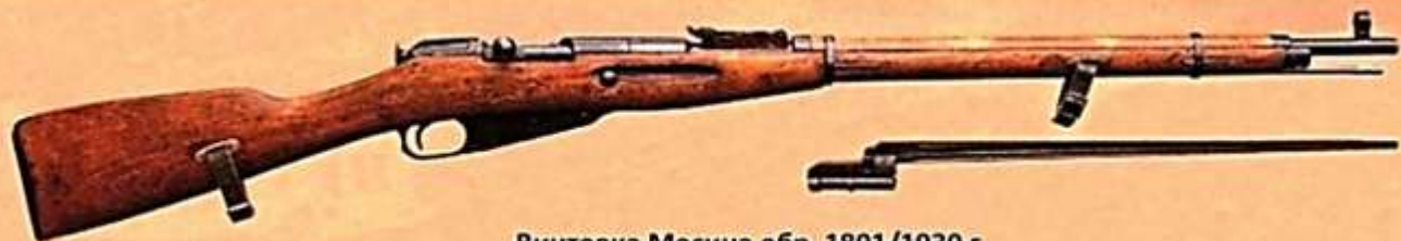
Винтовка Мосина обр. 1891/1930 г