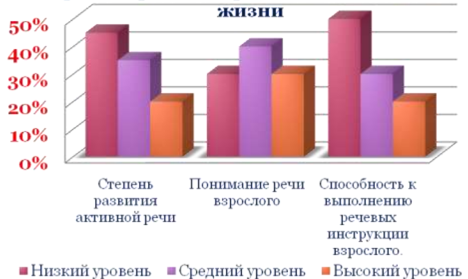
Уровень речевого развития детей 3 года жизни