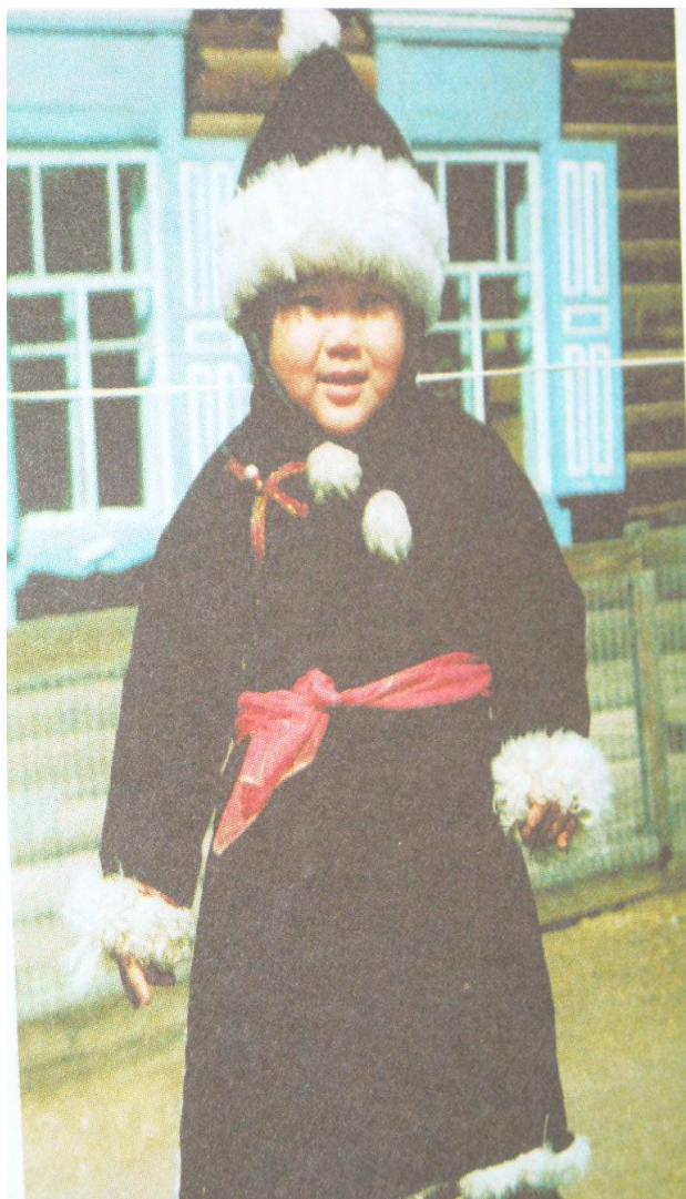
Бага үхибүүдэй хубсахан