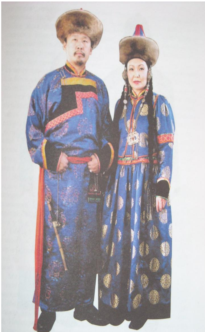
Агын бурядай хубсаһан