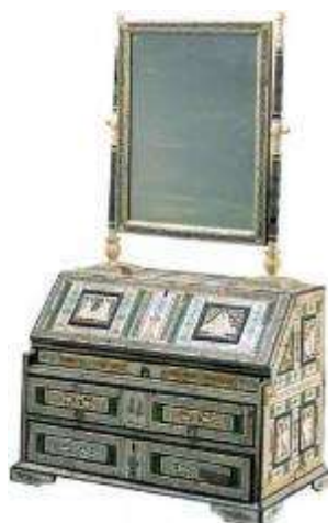
Рис. 7. Комод с зеркалом 18 век

Местные аборигены слыли замечательными железных дел мастерами, добывали железо, серебро, золото, мрамор и использовали различные технологии. Именно это явилось основанием для появления таких географических названий как Кузнецк и Кузнецкая котловина.