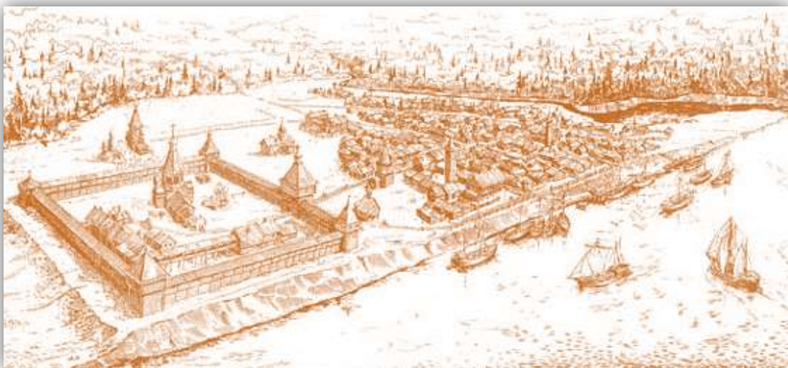
Рис. 5. Военные укрепления

Во время колонизации Кузнецкого края и присоединения Сибири к Российскому государству, которые строили сначала военные укрепления, а затем крестьянские старожильческие заимки и деревни.