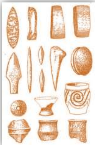
Рис. 2. Клад на берегу реки Ини

Также были найдены кости лошади, что указывает на присутствие элементов скотоводства.