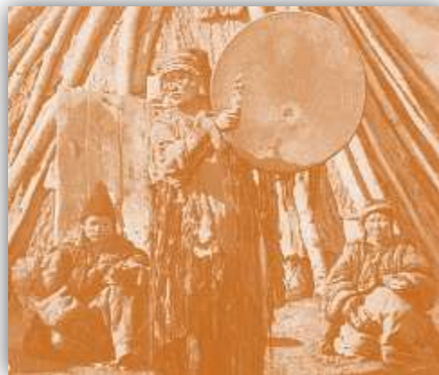
Рис. 6. Шаман

С приходом русских на землю Кузнецкой котловины происходят кардинальные изменения в хозяйстве и общественном строе коренных народов этой территории. Они сохраняли свой традиционный уклад. По своим верованиям они были шаманистами, окружающее пространство делили на три уровня – небо, землю и подземелье, верили в духов и совершали культовые обрядовые действия и жертвоприношения животных. При лечении больных роль врача выполнял шаман, который в качестве основного способа выздоровления применял камлания.