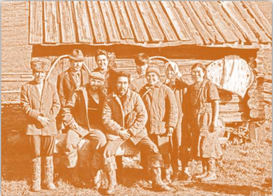
Рис. 4. Фотография коренных народов

На степных просторах проживали теленгуты (телеуты), племена тюрков (шорцы) тюлеберы, чедыберы, тогулы, абинцы, ачкыштымы, камлары, кумыши, шуйцы и ячинцы и русские люди - первопроходцы.