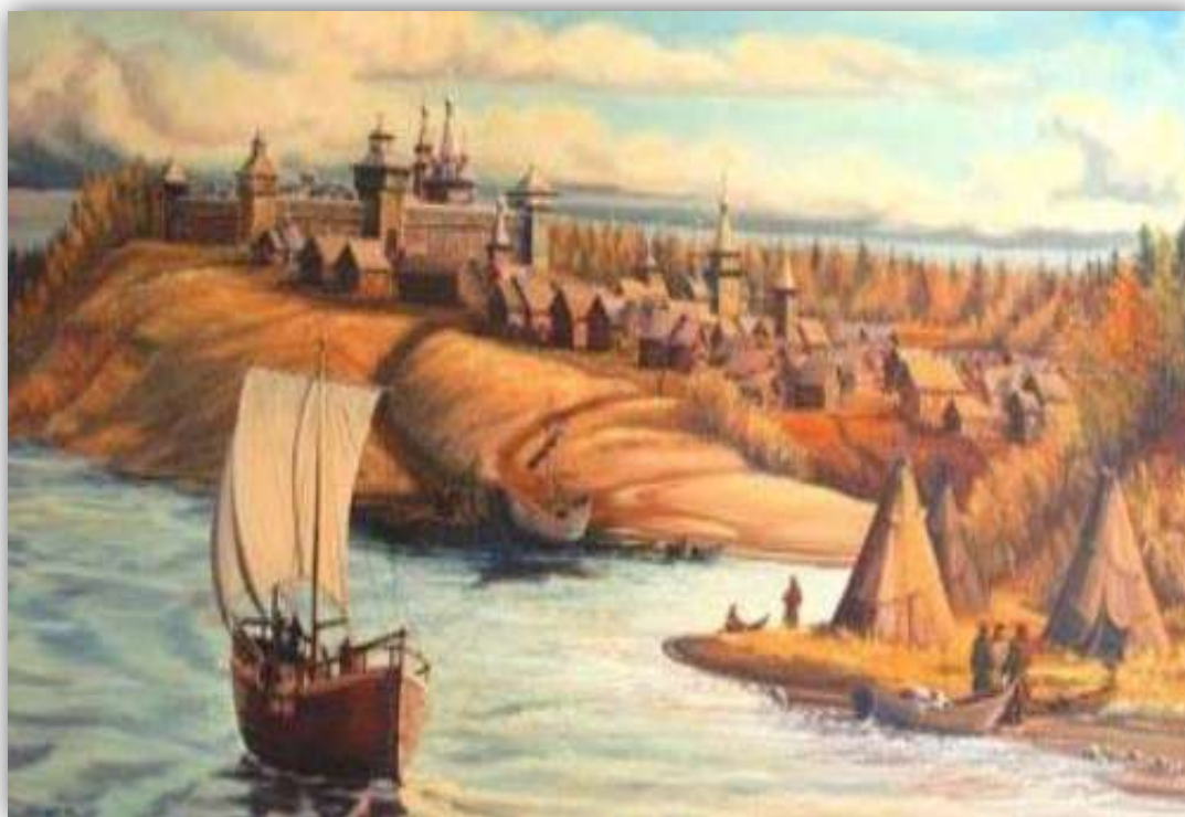
Рис. 7. Торговые связи

Налаживаются торговые связи с китайским народом, европейским, среднеазиатским. Учатся друг у друга земледелию, строительству, гончарному производству. Переходят на систему российского денежного общения. С 1718 года поступают сведения о наличии руды, угля. Начинается их освоение и разработка.