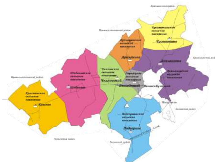
Рис. 10. Карта Ленинск-кузнецкого района