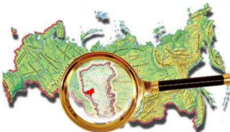
Рис. 1. Ленинск-Кузнецкий район на карте России

Ленинск-Кузнецкий район представляет собой маленькую точку на карте России. Вероятно, он мало кому известен, кроме жителей Кузбасса. Но местному населению, чья судьба связана с этой сибирской глубинкой, это название ассоциируется, с замечательным для каждого человека, понятием Родина. Для кого-то этот край знаком с раннего детства и отождествляется с родным домом, палисадником. улицами. дорогами, березовыми рощами, ягодными и грибными околками, бескрайними хлебными нивами, густыми снегопадами, ласковыми летними дождями. Для других, кто оказался здесь волею судеб в пору своей юности и зрелости, этот край стал близким и родным потому, что на этой земле, которая завораживает своей изумительной сибирской красотой, они возмужали и сформировались как личности.