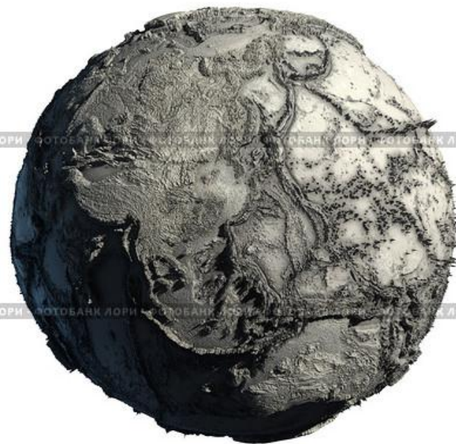
Мертвая планета Земля