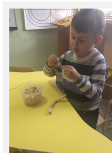
«Сделаем бусы для мамы»