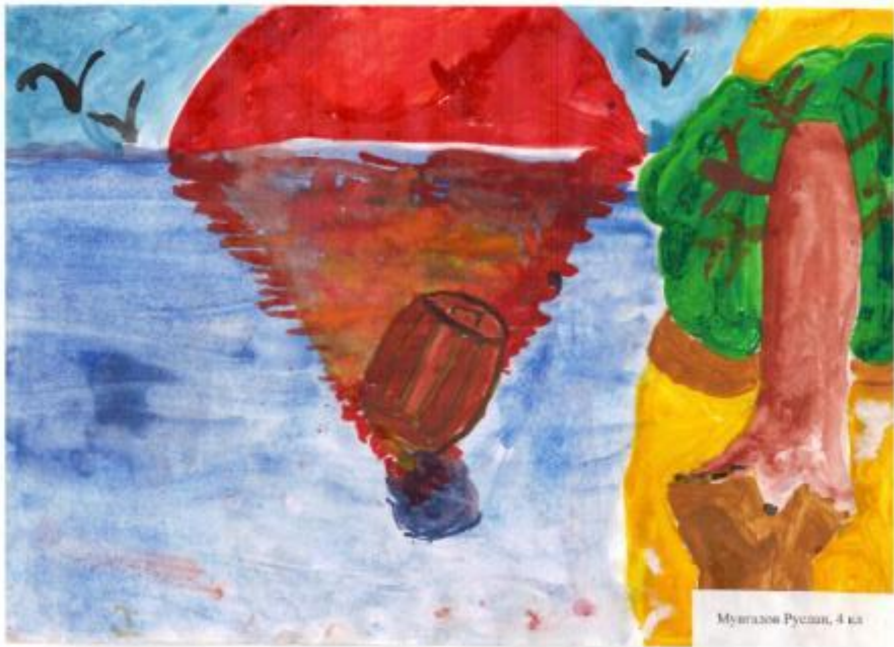
Мурталов Руслан, 4 кл