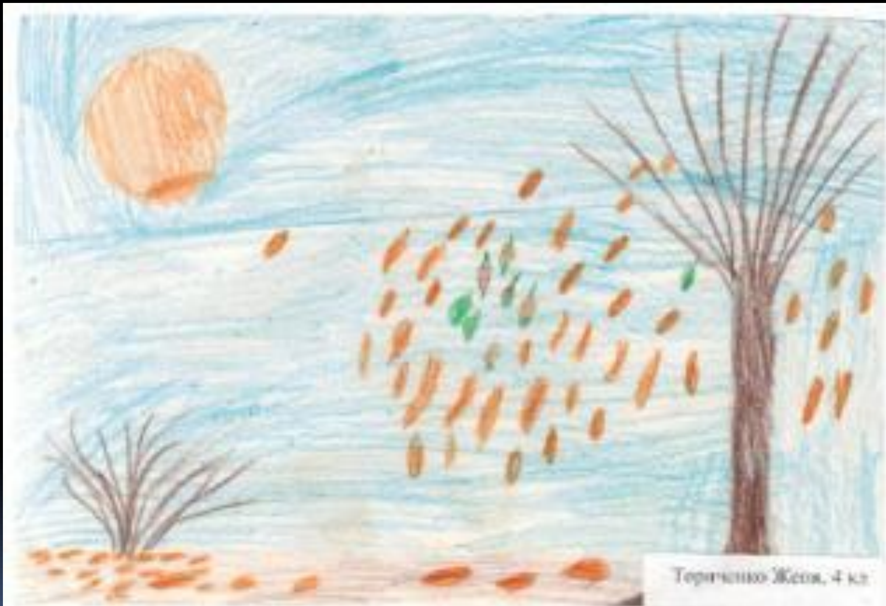
Теріченко Жетя, 4 кл