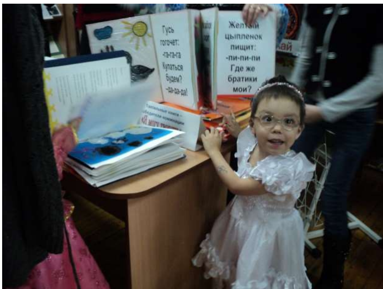
На следующий год я сделаю новую книгу и стану победителем! Честное слово!