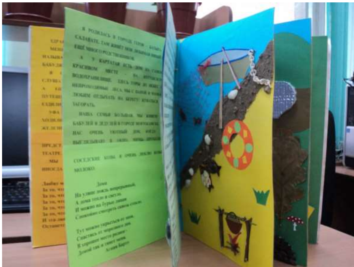
И книга и игрушка