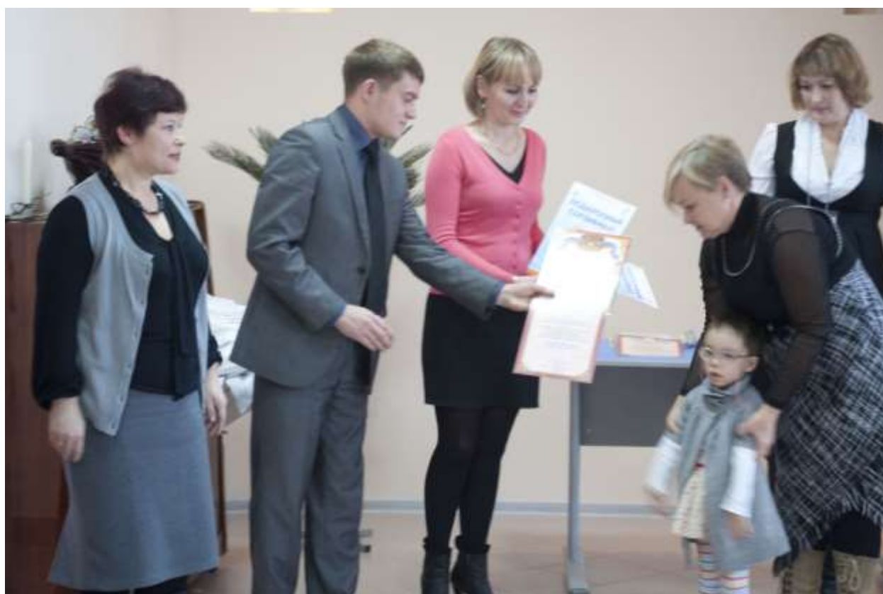
2-е место в номинации «Солнышко в ладошке». Награждение в городской детской библиотеке