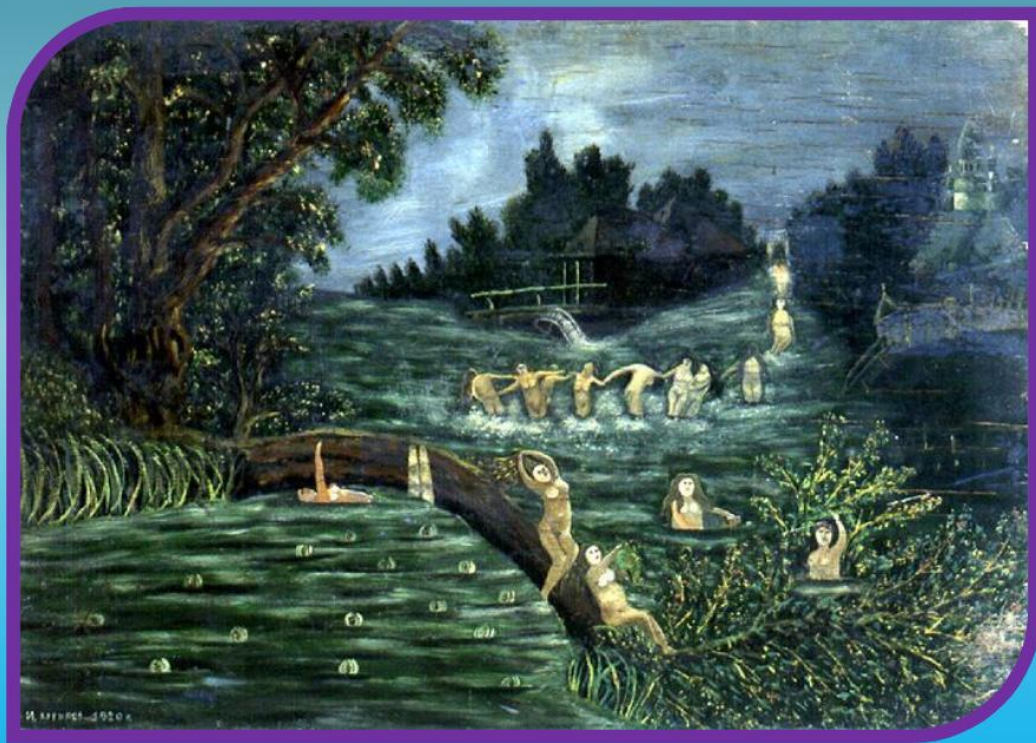
Художник: И. Курылев, «Ночь на Ивана Купала».

Впрочем, это не мешало нашим предкам от души повеселиться: парни и девушки, загадывая будущее, прыгали через костры, водили хороводы и, конечно, купались.