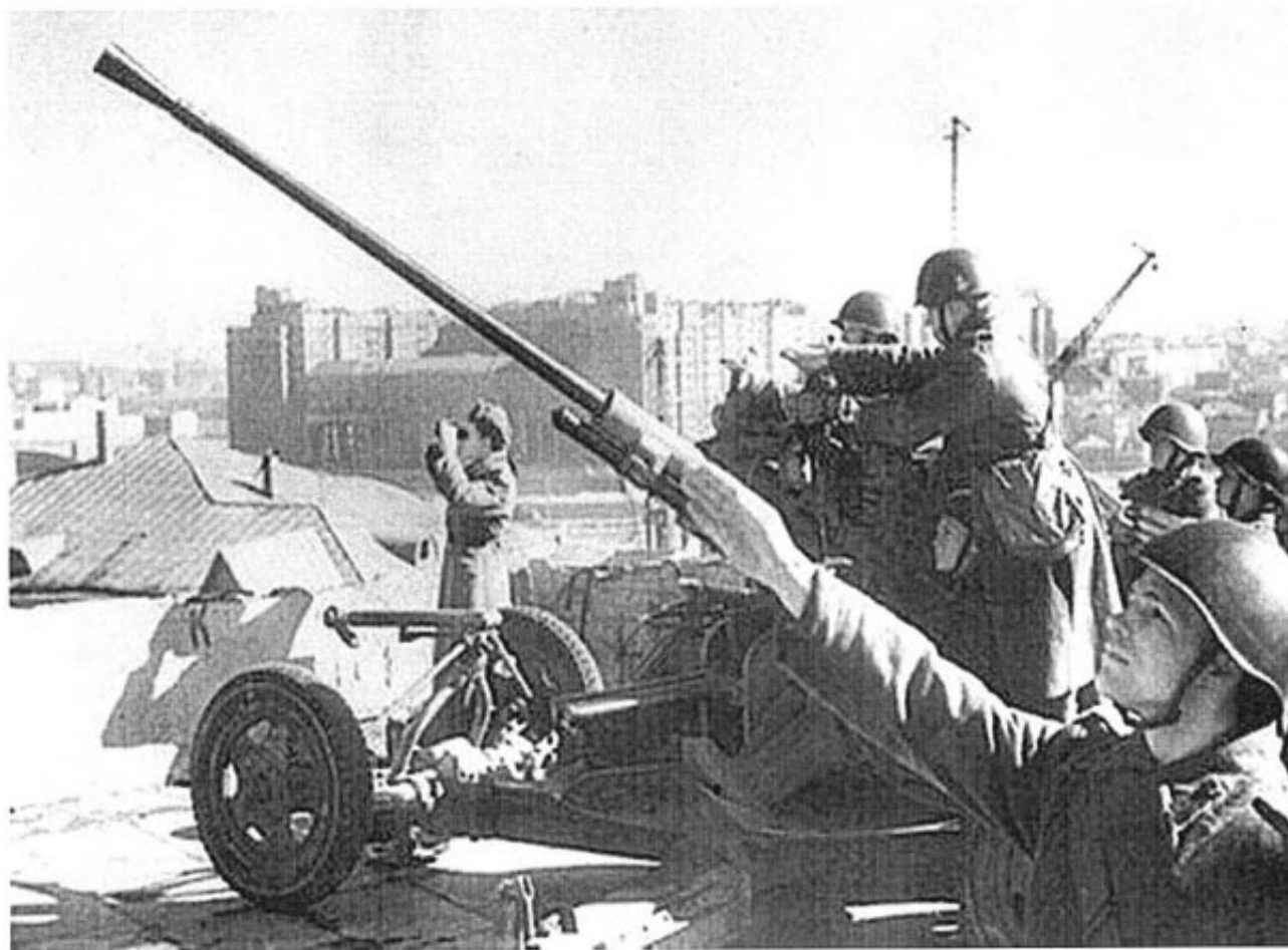
Оборона города от вражеской авиации.