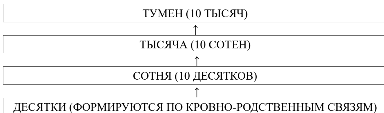
Рисунок 1. Организация монгольского войска.