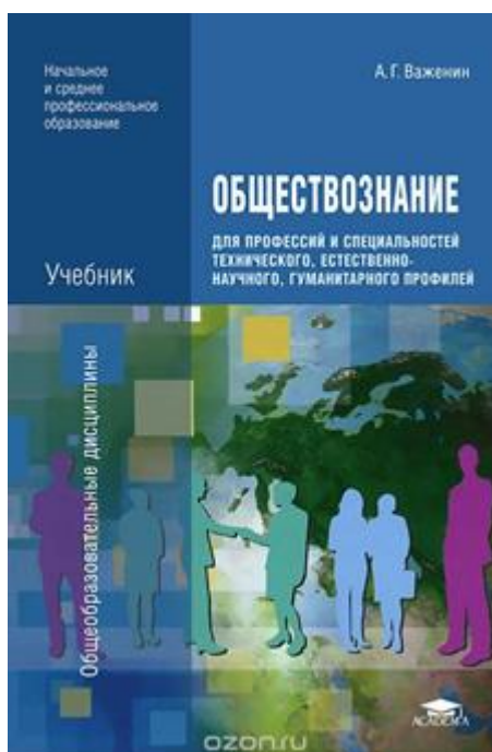
Рисунок 1. Важенин А. Г. Обществознание для профессий и специальностей технического, естественно-научного, гуманитарного профилей: учебник. — М., 2015.