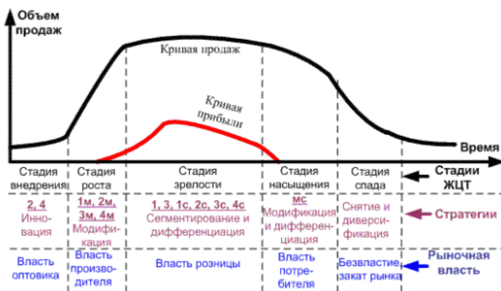
Рисунок 2.1 Стадии жизненного цикла товаров

Слово «Рисунок» и наименование помещают после пояснительных данных и располагают следующим образом: