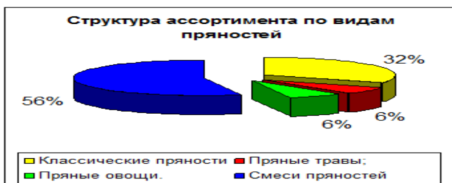
Рисунок 2.2. Динамика производства товаров, их структуру

Диаграммы эффективны в тех случаях, когда их точность не является основной задачей, а необходимо путем глазомерной оценки быстро определить превосходство одного процесса или явления над другими.