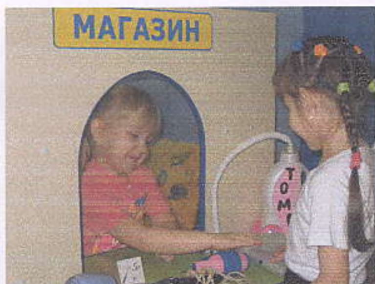
Сюжетно-ролевая игра «Магазин бытовой техники»

Какие же игровые действия с этим предметом, можно применять в сюжетно-ролевой игре: