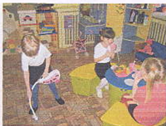
Сюжетно-ролевая игра «Семья»

«Детский сад», «Служба быта», «Автосалон»,