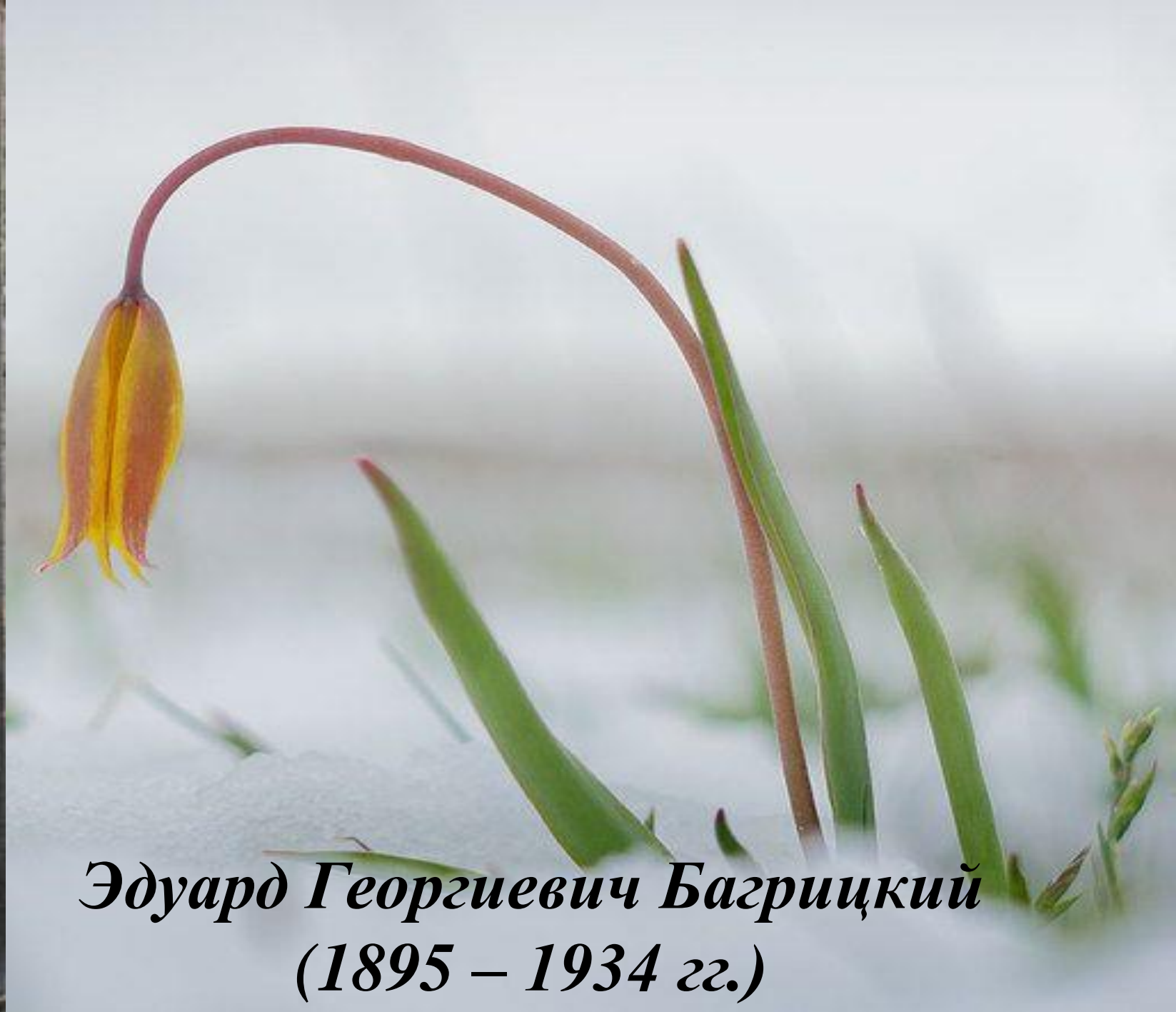
Эдуард Георгиевич Багрицкий (1895 – 1934 гг.)