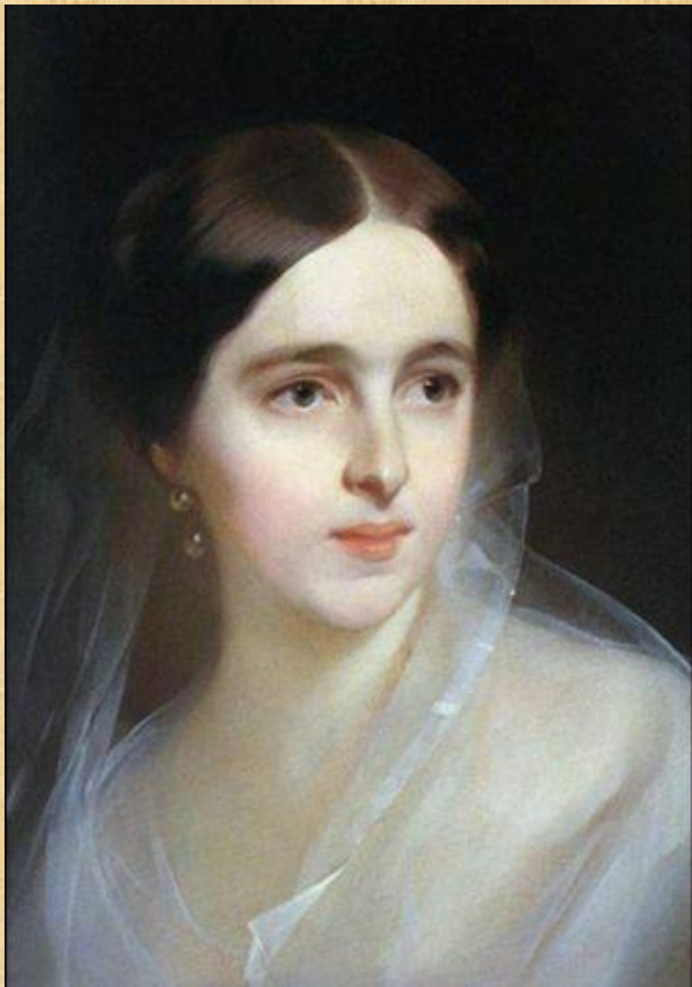
Наталья Николаевна Гончарова 1812 – 1863 гг.