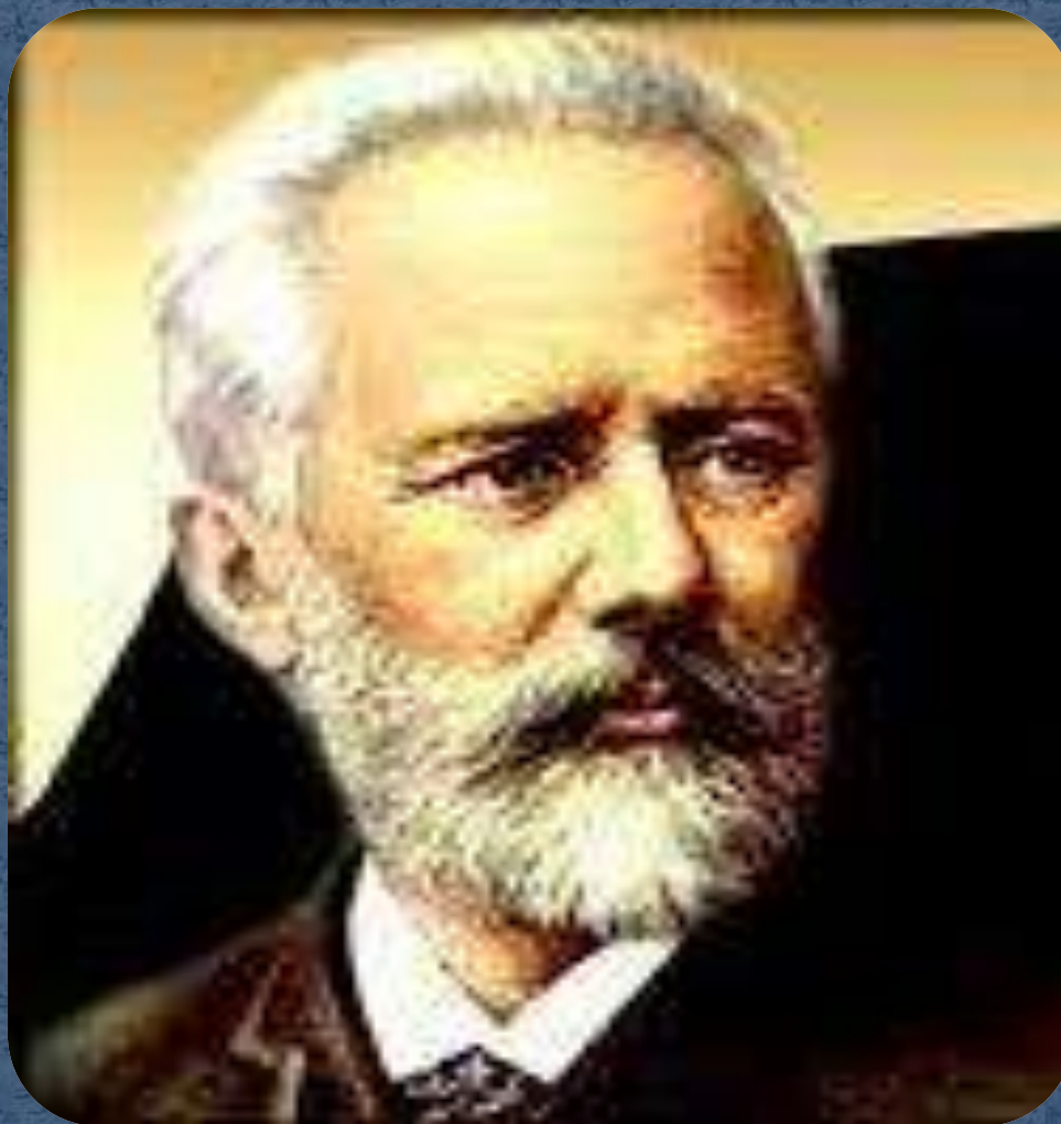
Пётр Ильич Чайковский