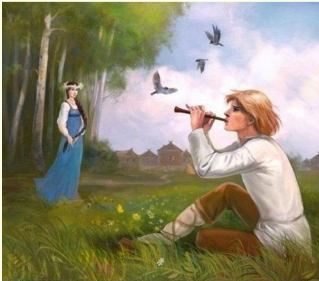
А. Н. Островский «Снегурочка»