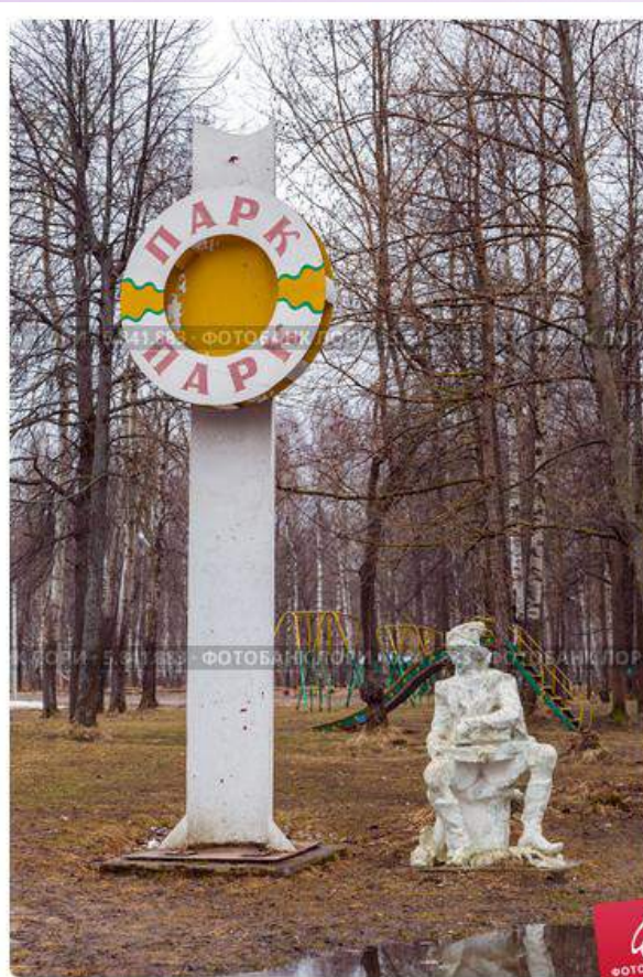
Город Волгореченск. Скульптура в парке