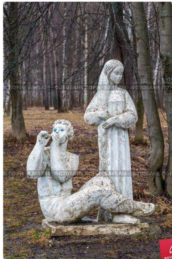
Город Волгореченск. Скульптура в городском парке