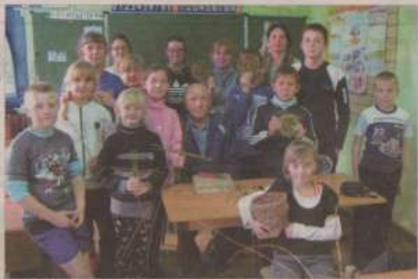
Ребята Акишатской школы из кружка по лозоплетению со своими педагогами.