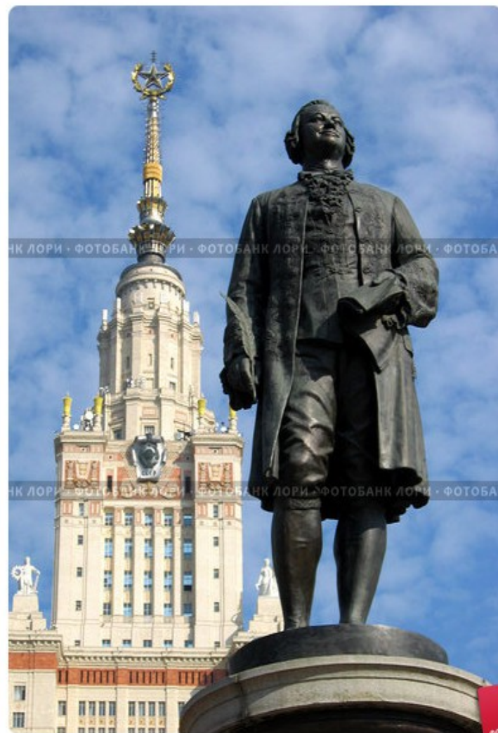
Памятник М.В. Ломоносову перед главным зданием МГУ

Фигуру Ломоносова первоначально планировали разместить на крыше.