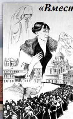
Тюрьма «Кресты». Санкт-Петербург.