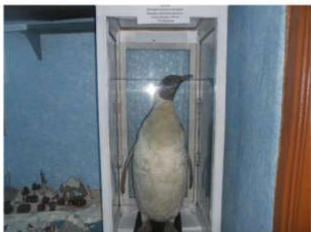
Чучело императорского пингвина