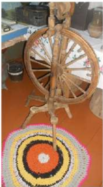
Вязаный коврик «кружок»