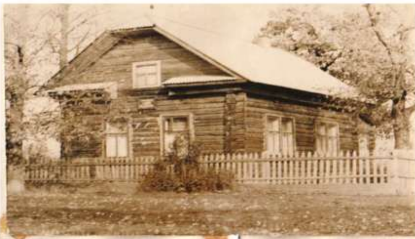
Общий вид музея В.И. Ленина