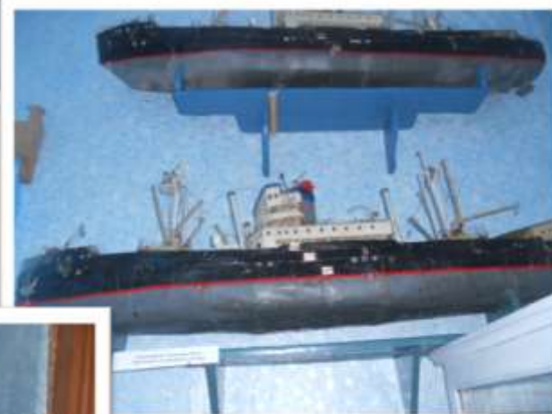
Макет дизель- электрохода «Обь»