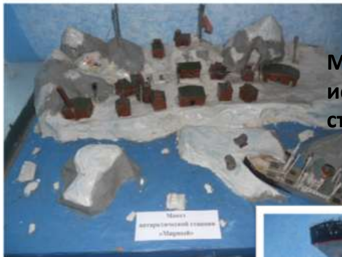
Макет исследовательской станции «Мирный»