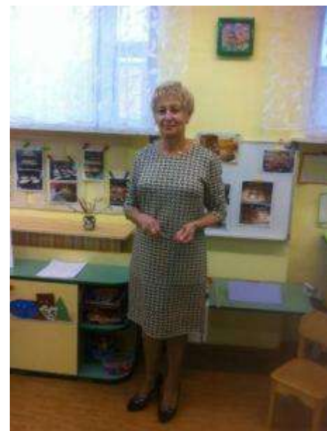
Колоски, зерна, мельничка