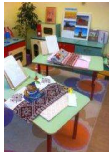
Пособия, предметы совместной деятельности