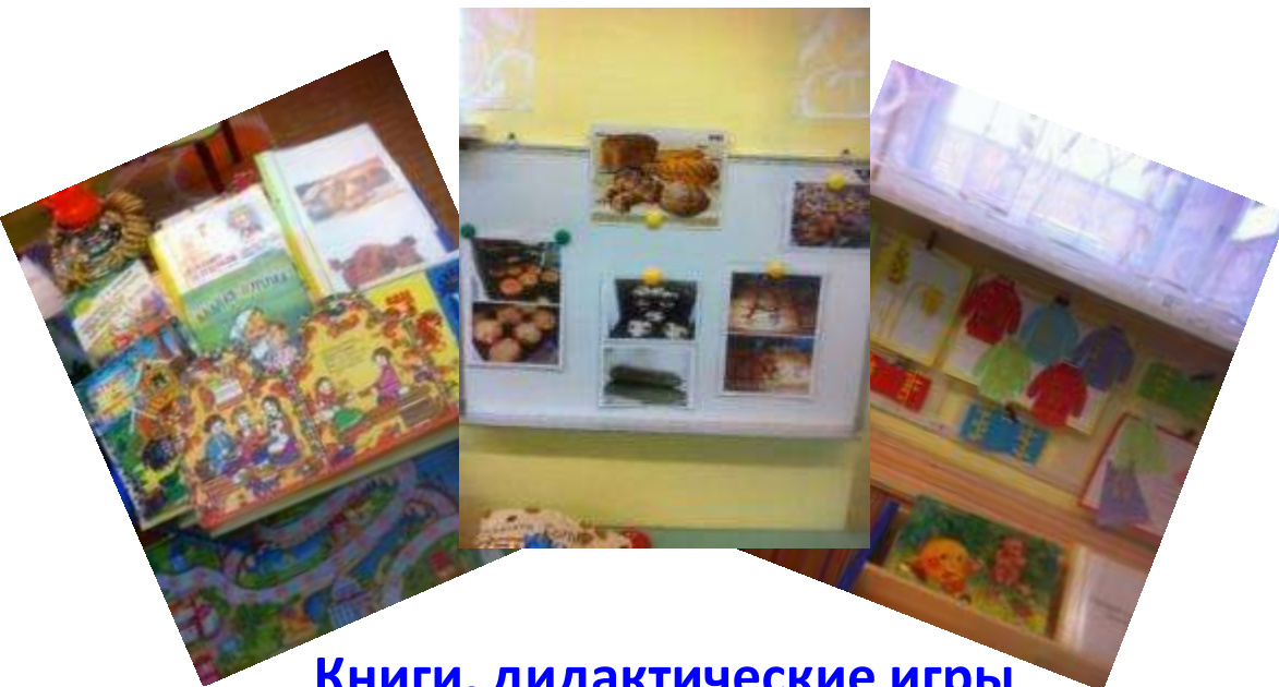
Книги, дидактические игры