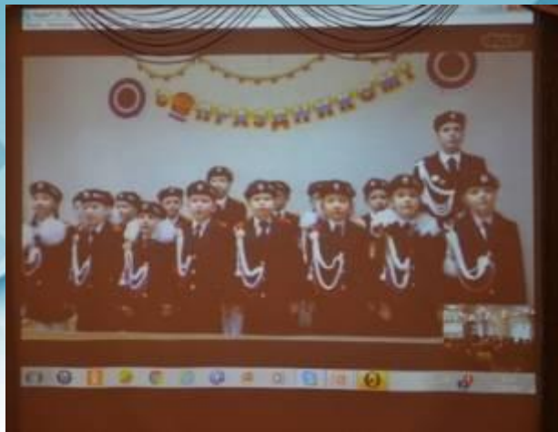
Поздравление по скайпу ко Дню города от детского сада «Солнышко» п.Пойковский