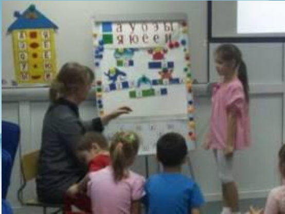
ОД по грамоте «Подводный мир»