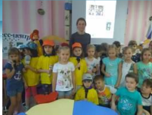
Проект «Профессии родителей»