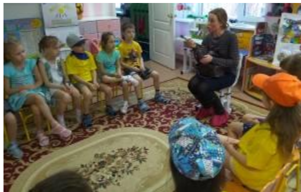
Встреча с корреспондентом Издательского дома «Новости Югры»