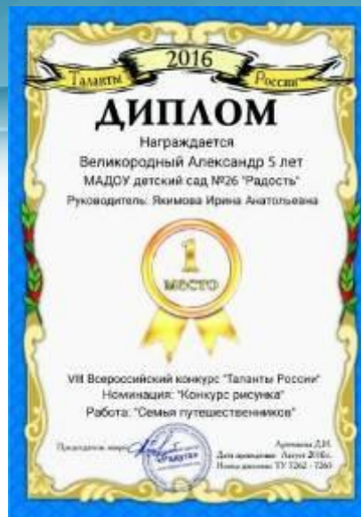
Диплом Победителя I место Всероссийский конкурс «Таланты России», 2016г.