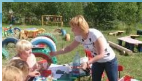
Практическая консультация «Создание среды на летнем участке»