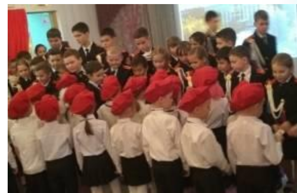
Вручение подарков кадетами – школьниками ко Дню города