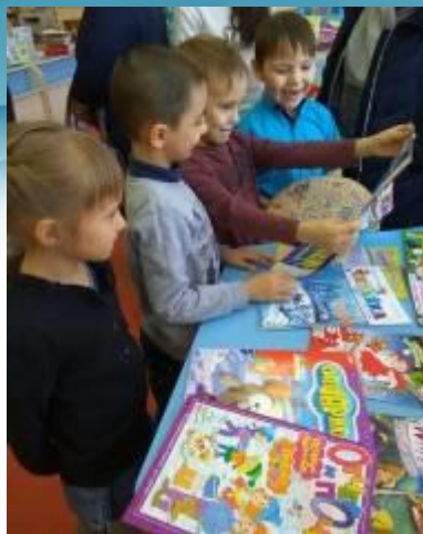
Участие в викторине «По страницам сказок» в детской библиотеке