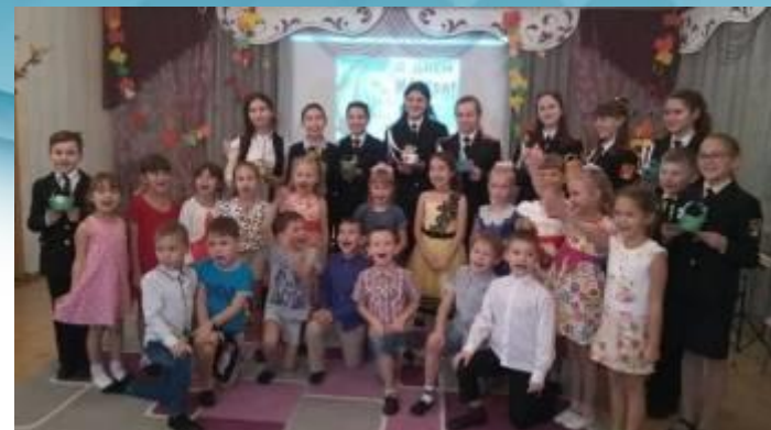
Праздничное мероприятие ко Дню Матери совместно со школьниками – кадетами