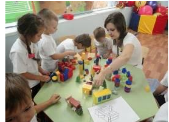
Проект «Мой город Нефтеюганск»