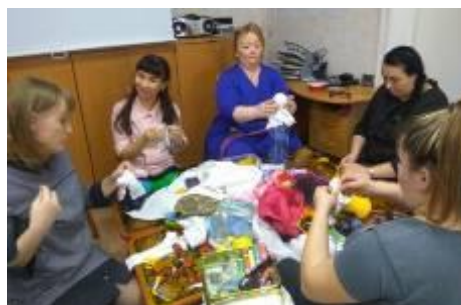
Совместное участие в конкурсах