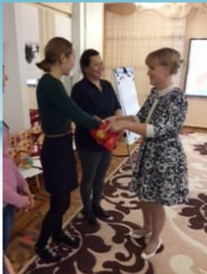
Деловая игра «Я идеальный воспитатель»