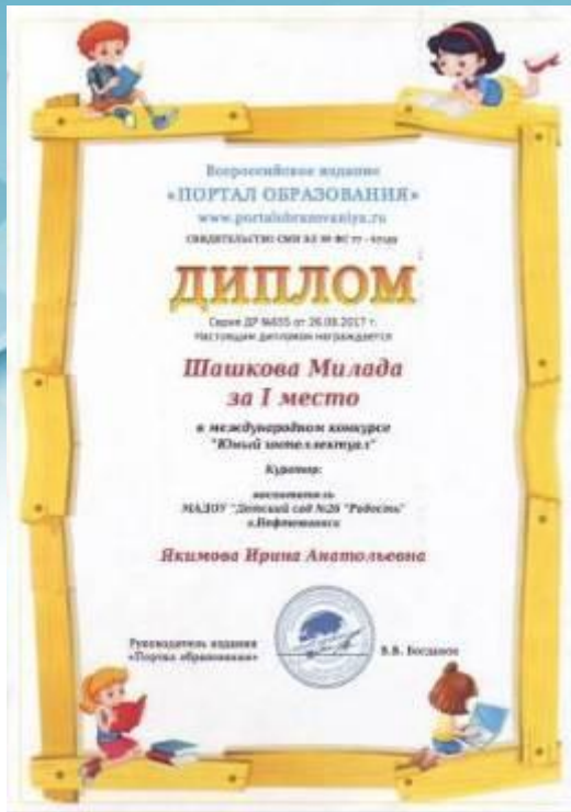
Диплом Победителя I место Международный конкурс «Юный интеллектуал», 2017