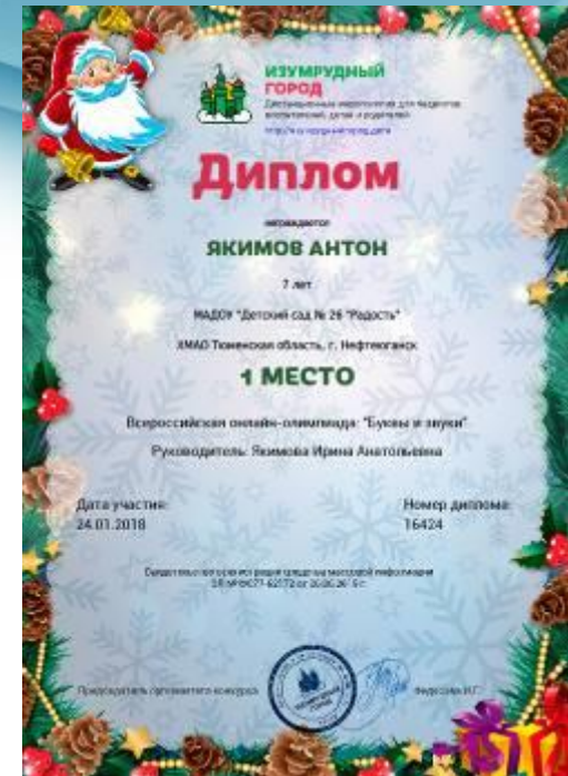
Диплом Победителя I место Всероссийская олимпиада «Буквы и звуки» 2018г.