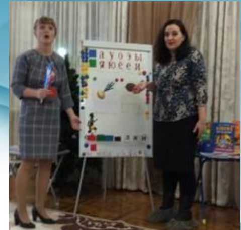
Мастер-класс «Чтение с увлечением»