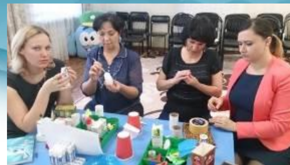
Мастер-класс для коллег «Чудесный мир театра»