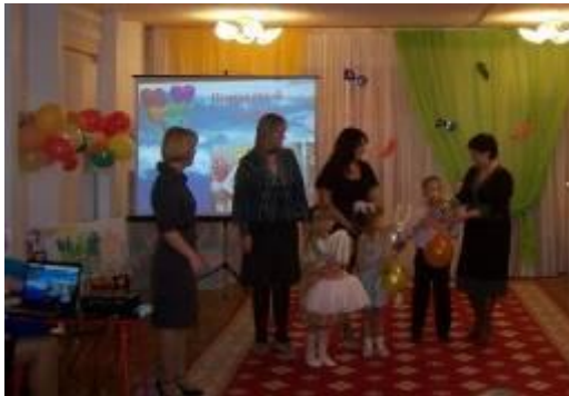
Презентация проекта «Мир театра»