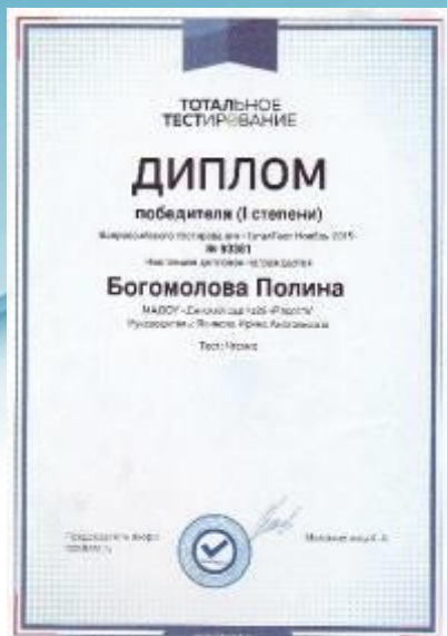
Диплом Победителя I место Всероссийское тестирование «Чтение» 2015