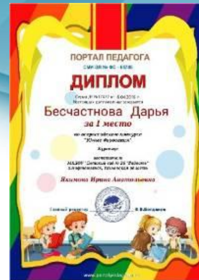
Диплом Победителя I место Всероссийский конкурс «Юные дарования» 2016г.