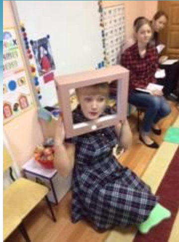
ОД по художественной литературе