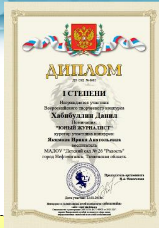
Диплом Победителя I место Всероссийский конкурс Номинация «Юный журналист» 2018г.