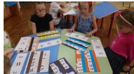
ФЭМП «В мире цифр»