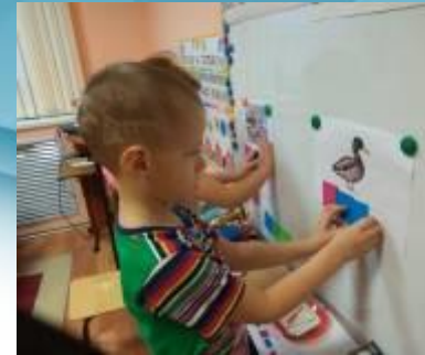
ОД по грамоте «Волшебные звуки»