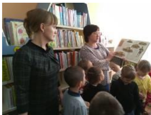
Экскурсия по детской библиотеке