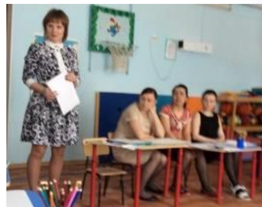
Практикум «Создание среды в группе согласно ФГОС ДО»