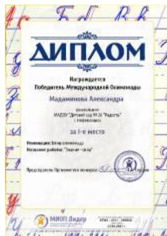
Диплом Победителей I место Международная олимпиада «Мир звуков и букв», «Знание – сила» 2016г.