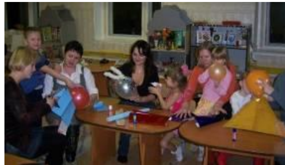
Мастер – класс «Чудесный мир театра»