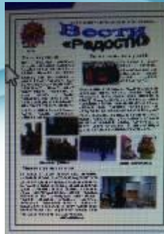
Клуб «Журналисты – активисты», создание газеты