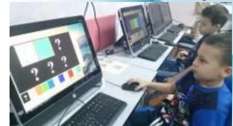
С применением СИРС – технологии

Показ открытой образовательной деятельности для молодых специалистов