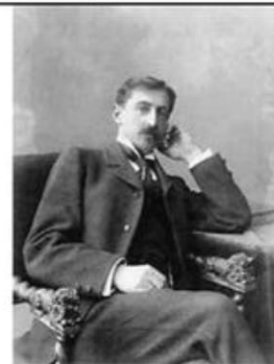
ИВАН АЛЕКСЕЕВИЧ БУНИН