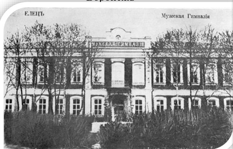
Елецкъ. Мужская гимназія. 1881 г.