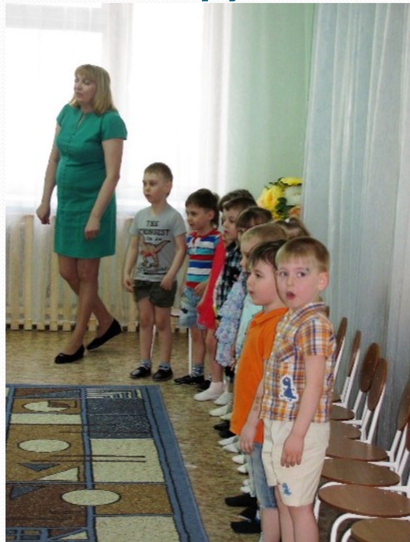
Театрализованное представление по сказке «Теремок»