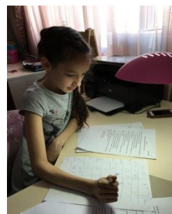
Составитель: Войтюк Екатерина