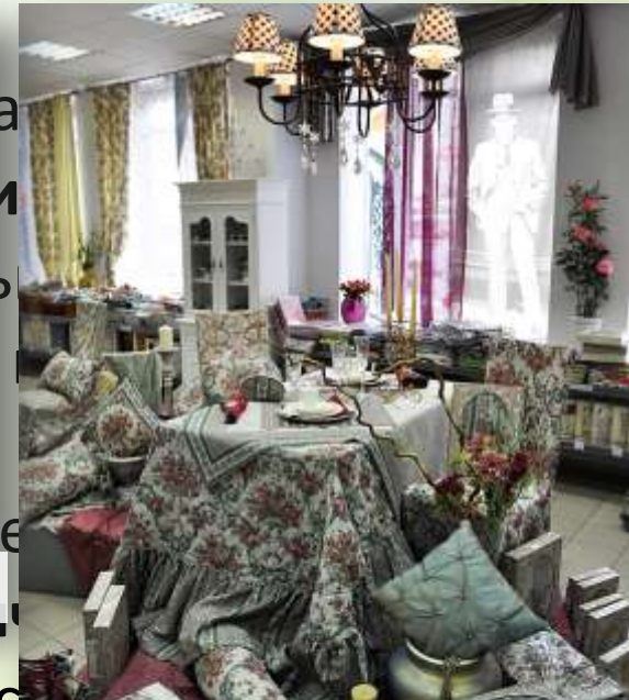
Трехгорная мануфактура, Москва