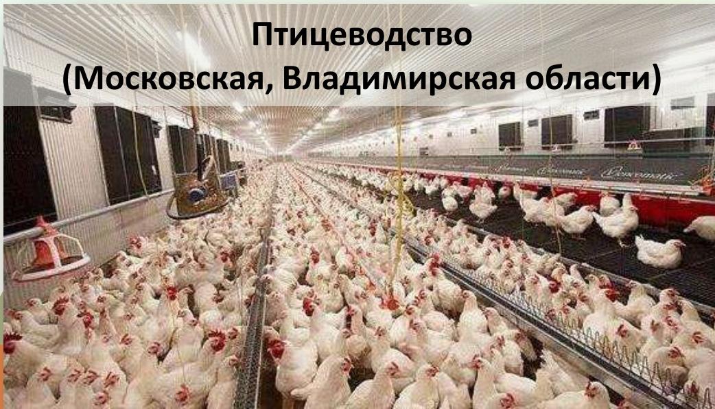
Птицеводство (Московская, Владимирская области)