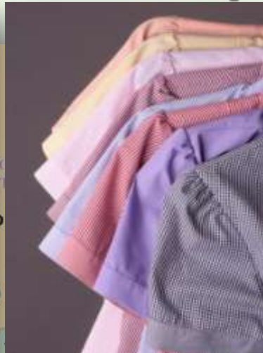
Изделия швейных предприятий г. Москвы