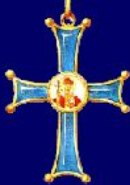
Знак ордена I степени