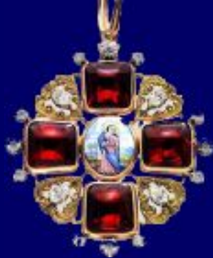
Знак ордена I степени с алмазами