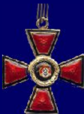
Знак ордена II/III степеней