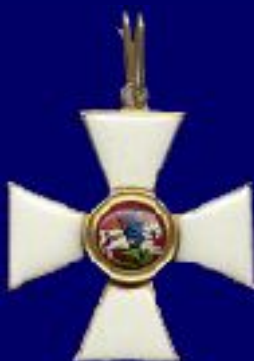
Знак ордена II степени