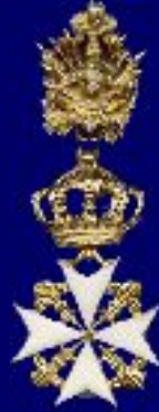
Знак ордена I степени