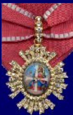
Знак ордена I степени