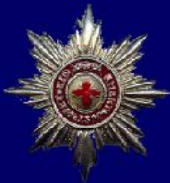
Звезда ордена I степени