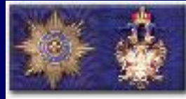
Императорский и Царский Орден Белого Орла

Год включения в состав российских орденов - 1831