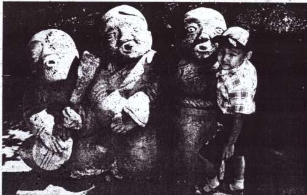
"Шулуртқайып турбайн, Шупту дейде ырлажымлы."