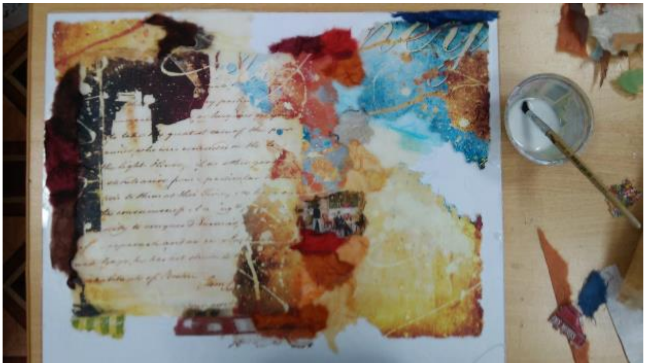
2. Наклеивание карты.