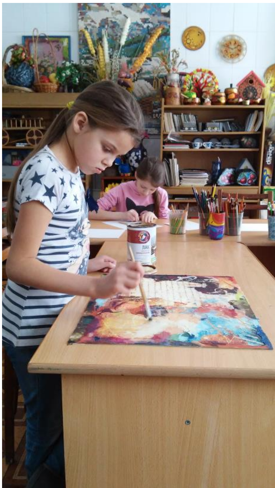
4. Дорисовка изображения акриловыми красками.