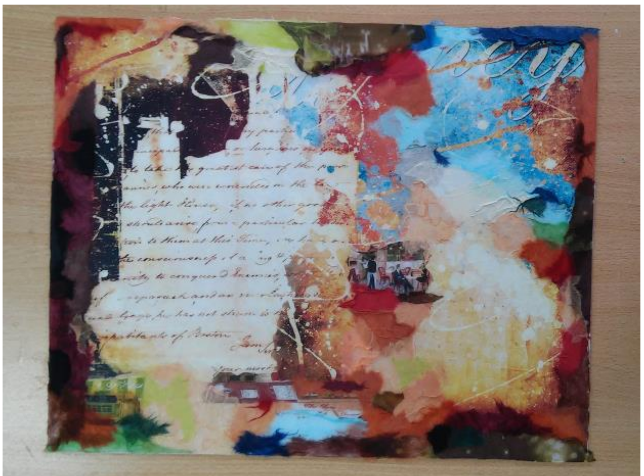
3. Заполнение пустых мест декупажной бумагой.