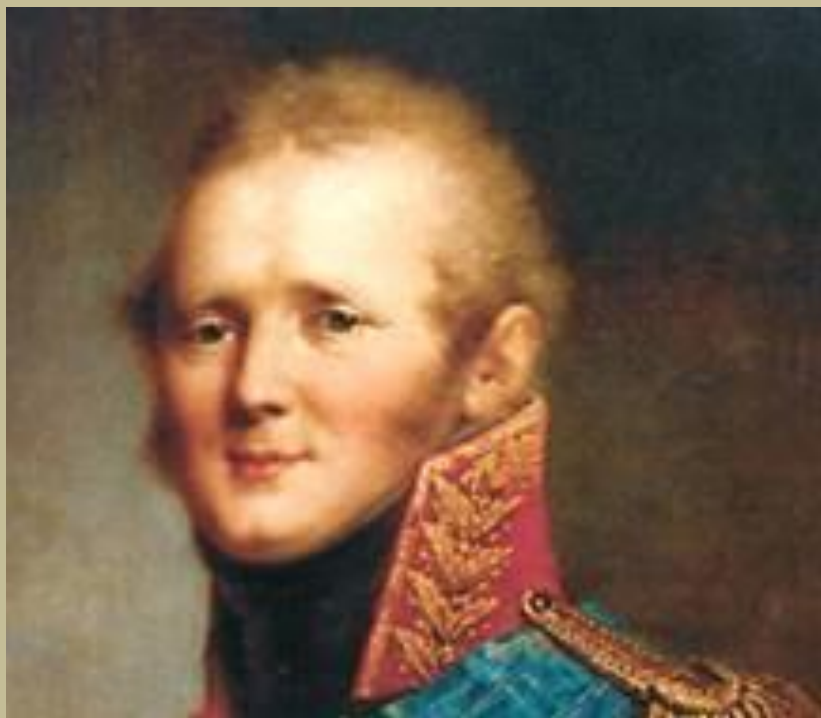
Наш Император Александр 1