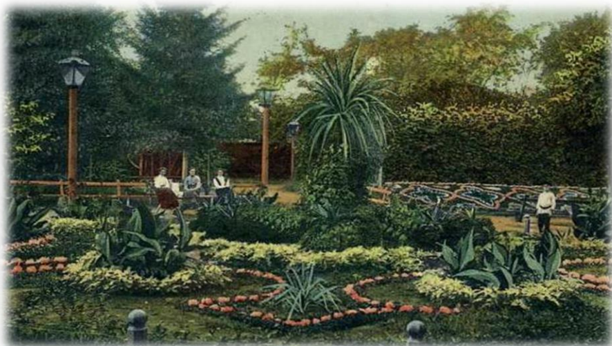
Приложение 5. В ожидании перемен