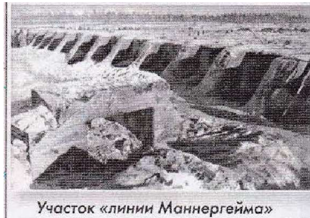
Участок «линии Маннергейма»

По мирному договору Карельский перешеек, северное и западное побережье Ладожского озера с городами Выборг, Кексгольм и Сортавала перешли к СССР. В районе Кандалакши граница Финляндии, близко подходившая к Мурманской железной дороге, была несколько отодвинута на запад. На севере к СССР отошли небольшие части полуостровов Средний и Рыбачий и группа островов в Финском заливе. СССР получил в аренду на 30 лет полуостров Ханко с прилегающими к нему островами для сооружения военно-морской базы.