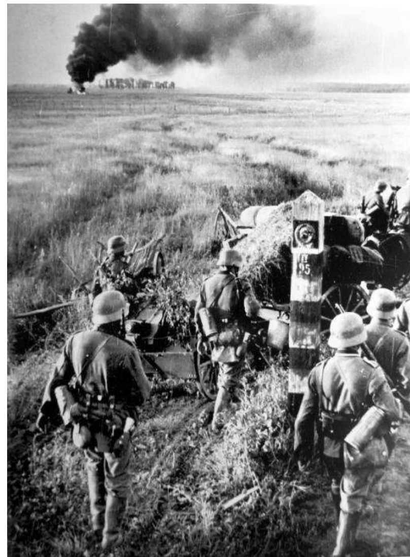
Войска вермахта пересекают границу СССР

☞ Соглашение так и не состоялось. В декабре 1940 г. Гитлер подписал план «Барбаросса», назначив нападение на СССР на май 1941 г. Однако весной 1941 г. немецкие войска приняли участие в военных действиях на Балканах (были захвачены Югославия и Греция). Поэтому дата нападения на Советский Союз была перенесена на 22 июня.