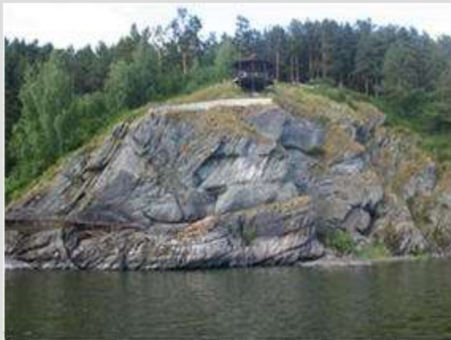
«Томская писаница» находится на территории Яшкинского района на правом берегу р. Томь

Памятники природы — это достопримечательные природные объекты, подлежащие охране: водопад, пещера, роща редких деревьев, уникальное дерево