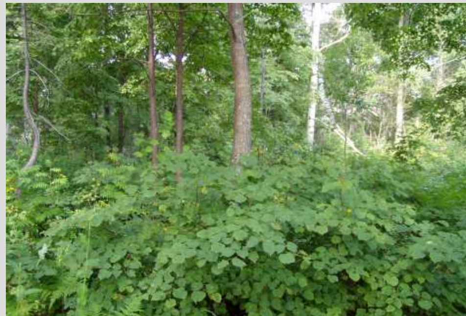
Реликтовая липовая роща в бассейне рек Большой и Малый Теш на правом берегу реки Кондома у ж/д станции Кузедеево