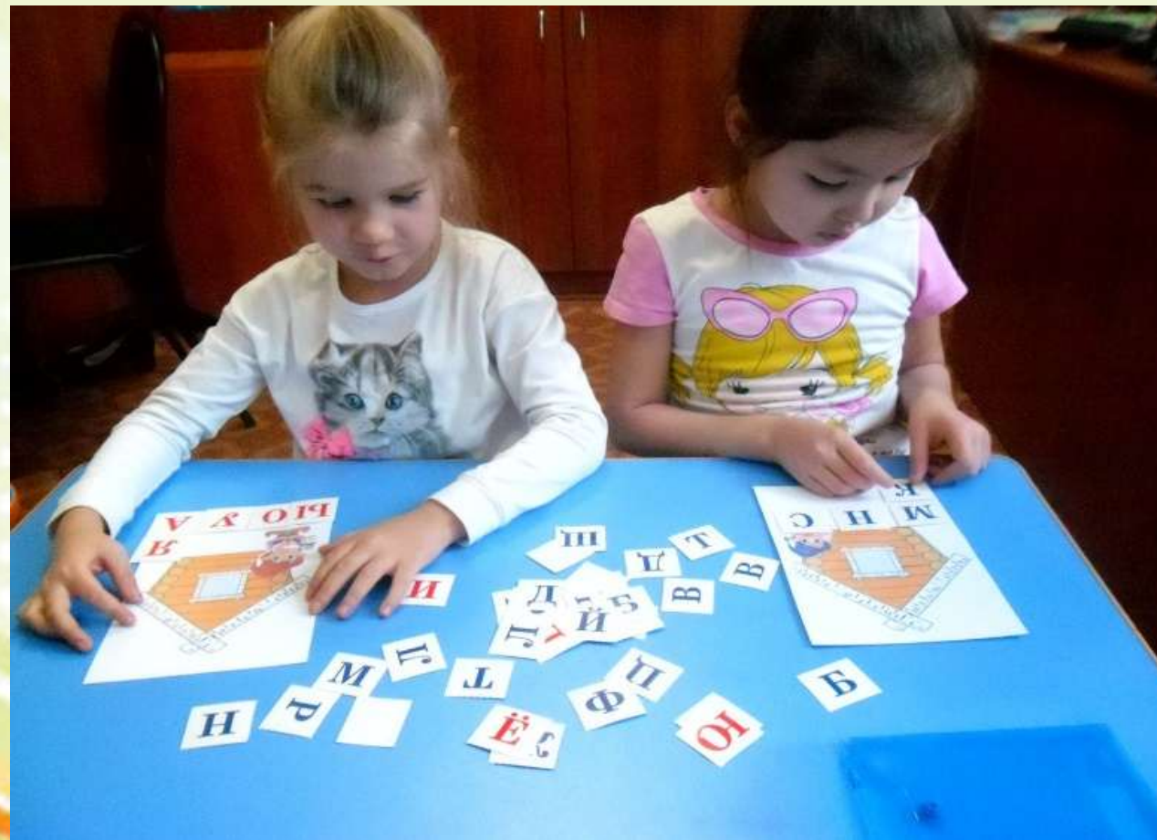
«Рассели буквы по домикам»