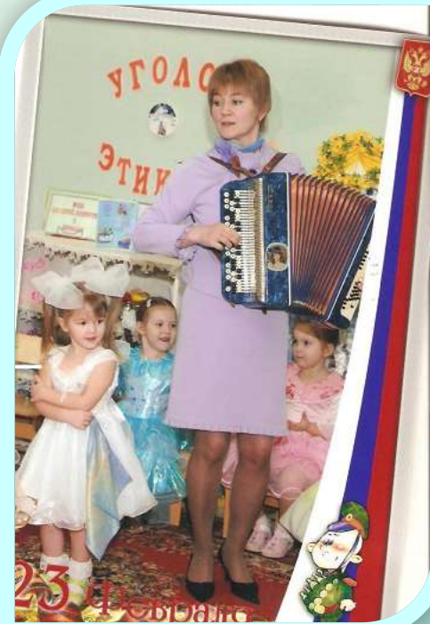
И к тому же ещё баянист