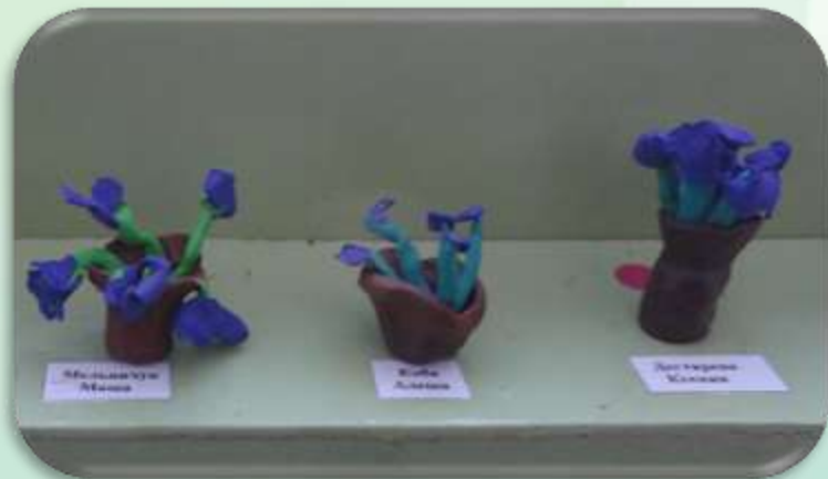
Лепка «Узамбарская фиалка»