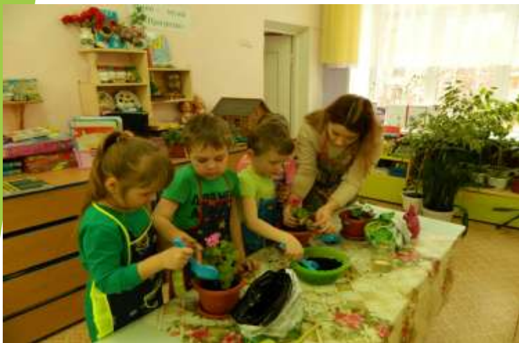
Мастер - класс «Посади комнатное растение»