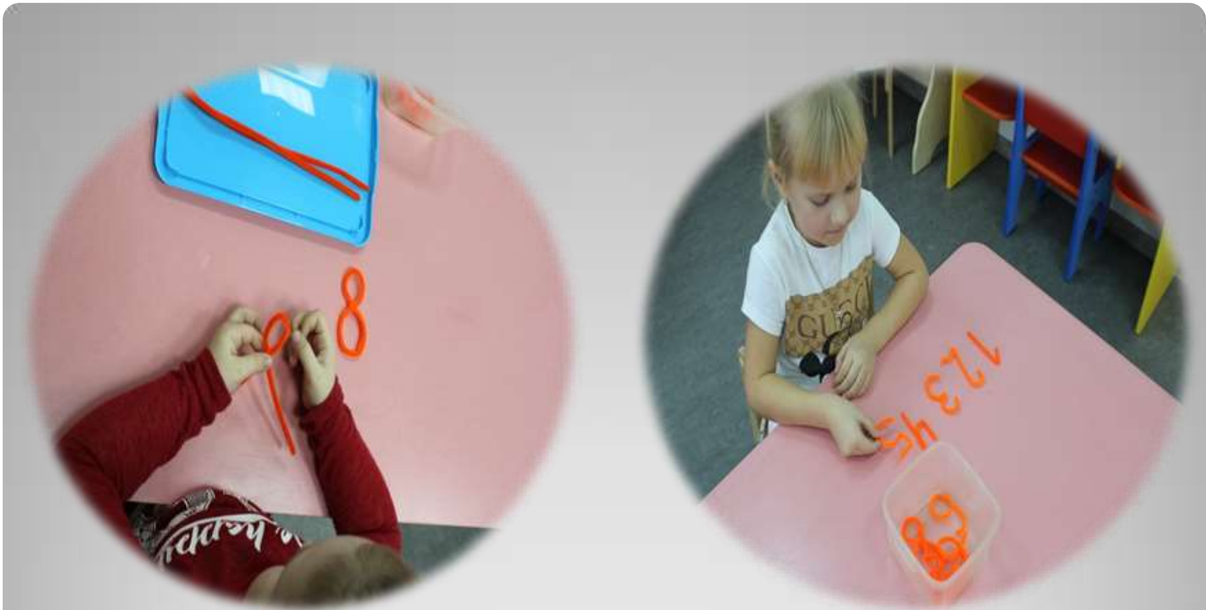
Дидактическая игра «Дружные цифры».