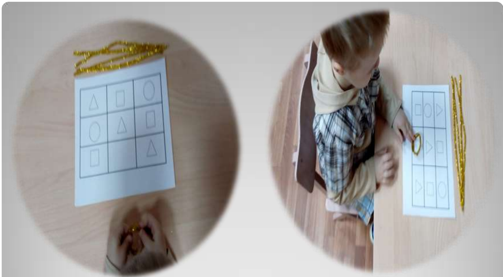
Дидактическая игра «Волшебная проволочка».