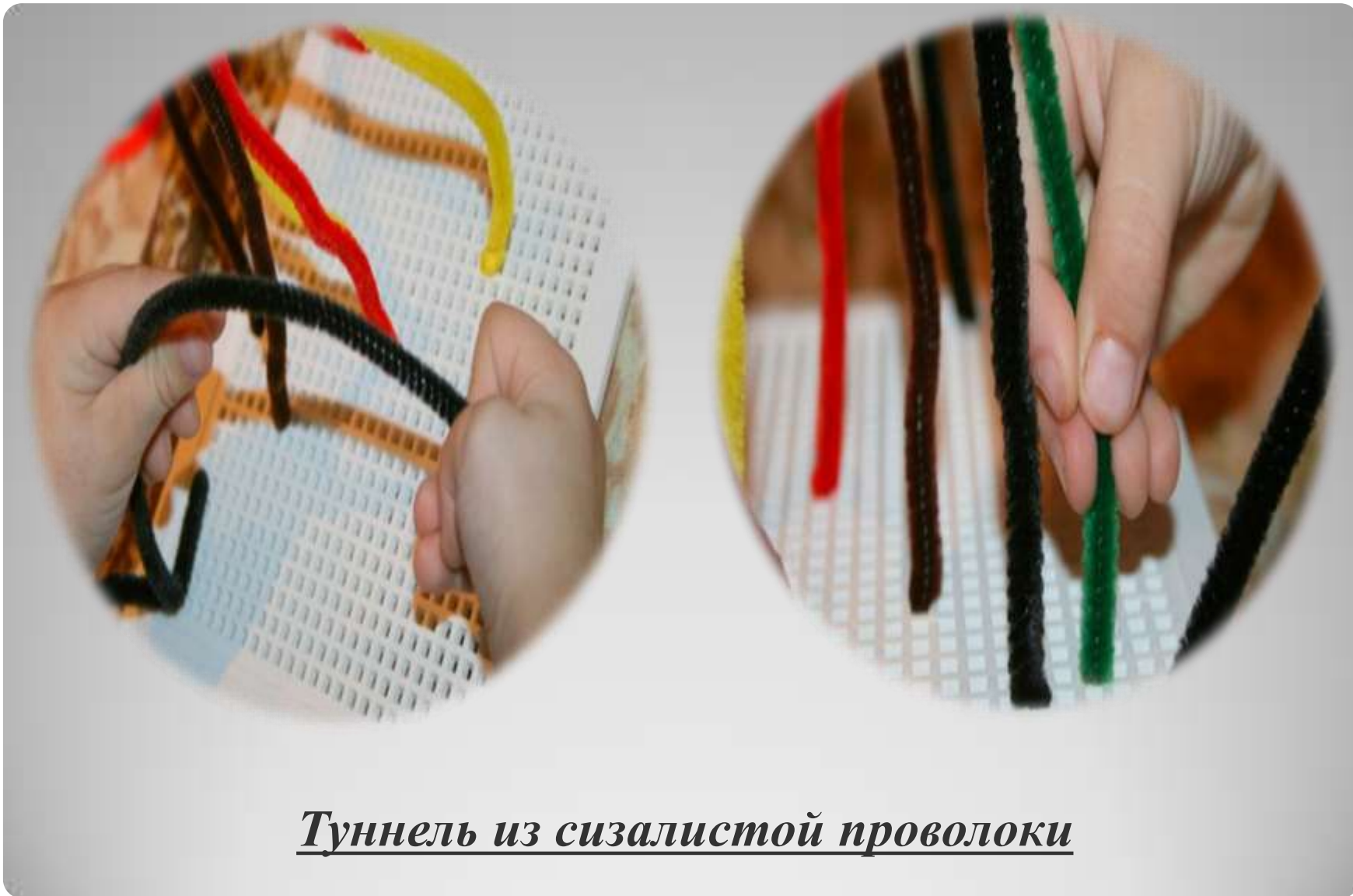
Туннель из сизалистой проволоки