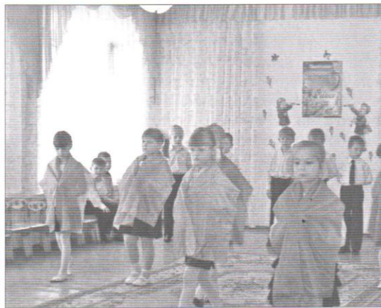
Музыкально-литературная гостиная «Спасибо деду за Победу!»