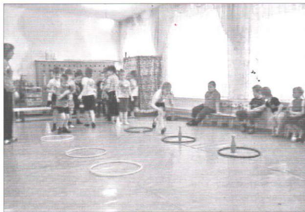
«Веселые старты» в рамках «Всемирного Дня здоровья»